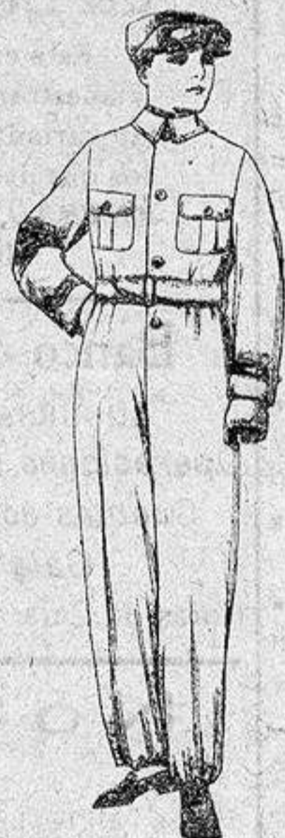
Trajes de dril azul, beige, kaki, etc., para aviador, motociclista, mecánico, etc., de ptas. 18 a 25.

Gamisería, Géneros de punto, Gorbatería, Guantería, Sombrerería, Zapatería, Paraguas, Bastones y artículos de viaje