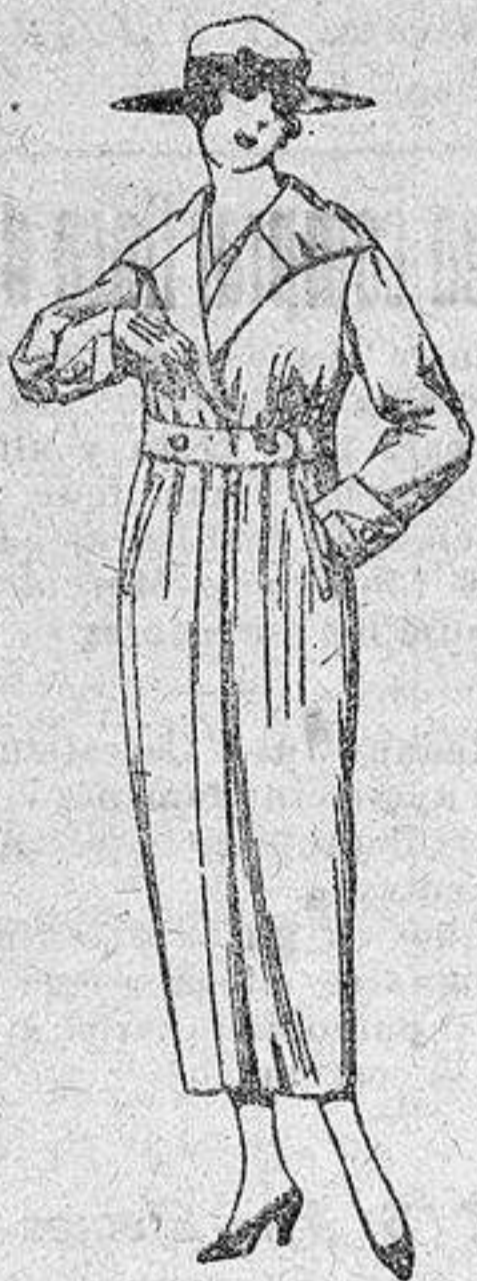
Guardapolvos de gabardilla, dril y alpaca, colores beige, kaki, gris, etcétera, de ptas. 22 a 55.

Ropas confeccionadas para Caballero, Señora, Niño y Niña