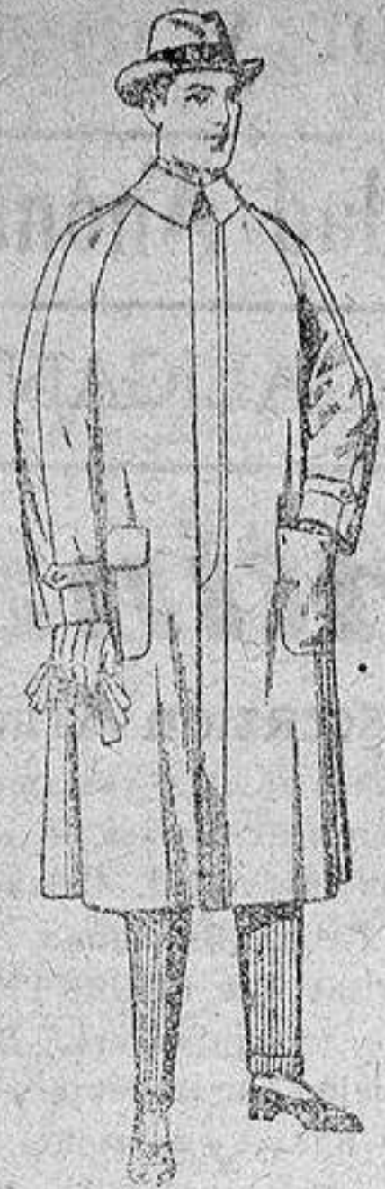
Impermeables, forma gabán, «Reglón», de pesetas 40 a 150

SUCURSALES: Madrid, Barcelona, Almería, Bilbao, Cádiz, Cartagena, Gijón, Granada, Málaga, Palma de Mallorca, Santander, Sevilla, Valencia, Valladolid y Zaragoza.