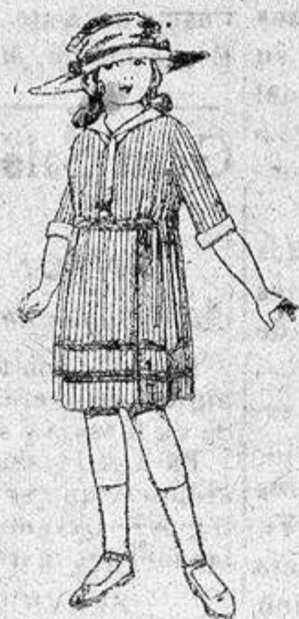
Vestidos de voile, listados, adornos blancos, para niñas de 4 a 9 años, de ptas. 22 a 32.