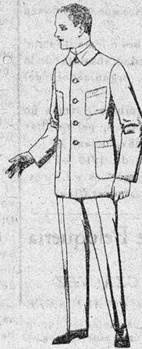
Trajes de dril azul, para mecánicos, de ptas. 17 a 25.

Gamisería, Géneros de punto, Gorbatería, Guantería, Sombrerería, Zapatería, Paraguas, Bastones y artículos de viaje