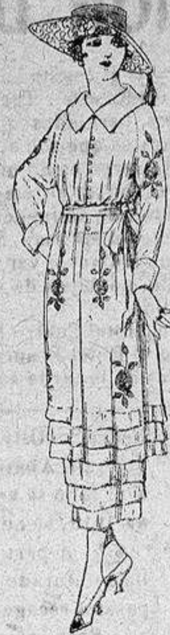
Vestidos de etamín blanco, azul y color, adornos bordados, de ptas. 50 a 68.