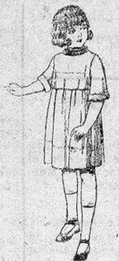
Vestidos de seda liberty, pongée, etc., para niñas de 7 a 12 años, de pesetas 30 a 38.