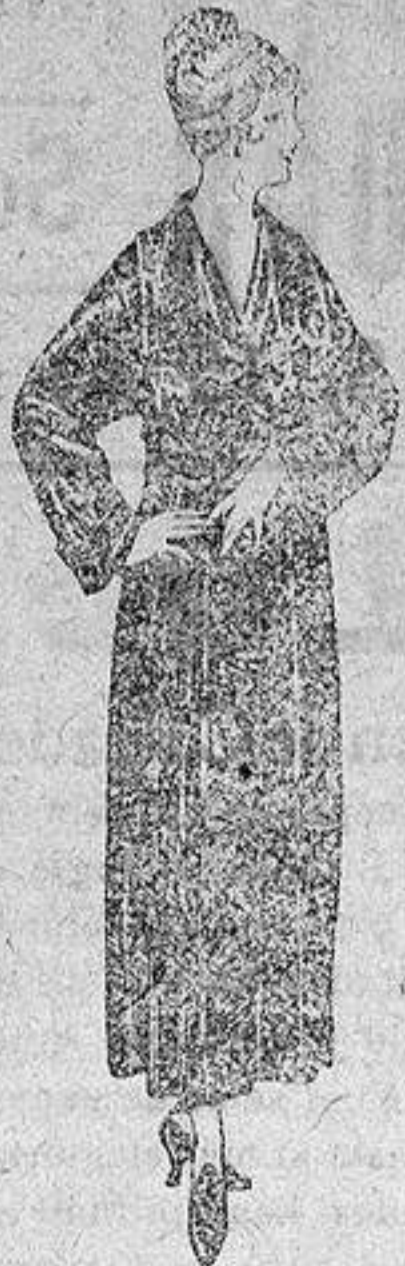
Batas de crepón, esterilla, etc., de ptas. 32 a 46.