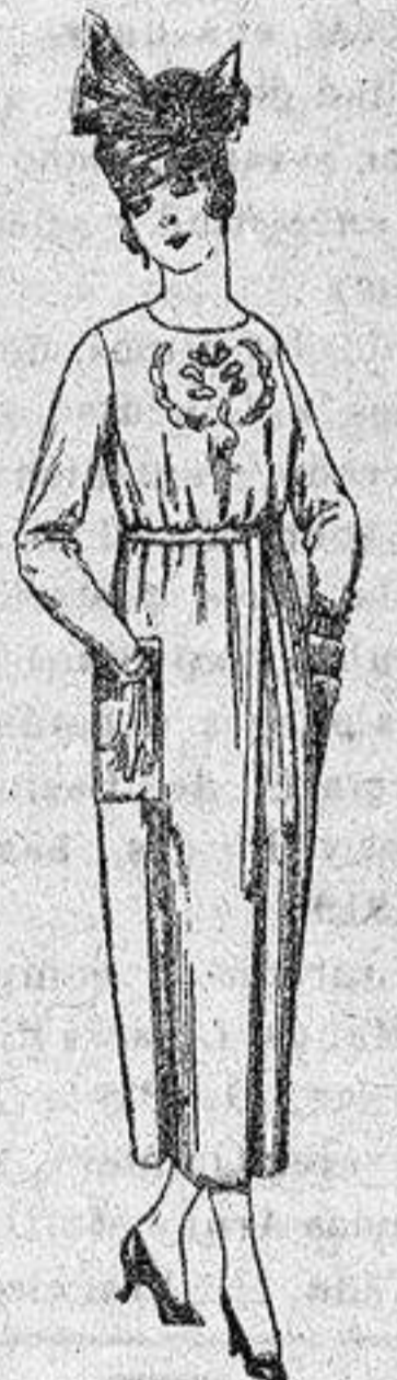
Vestidos de tricot de lana, en azul y colores, bordados a mano, a pesetas 112.

PRECIO FIJO - Pídase el catálogo general