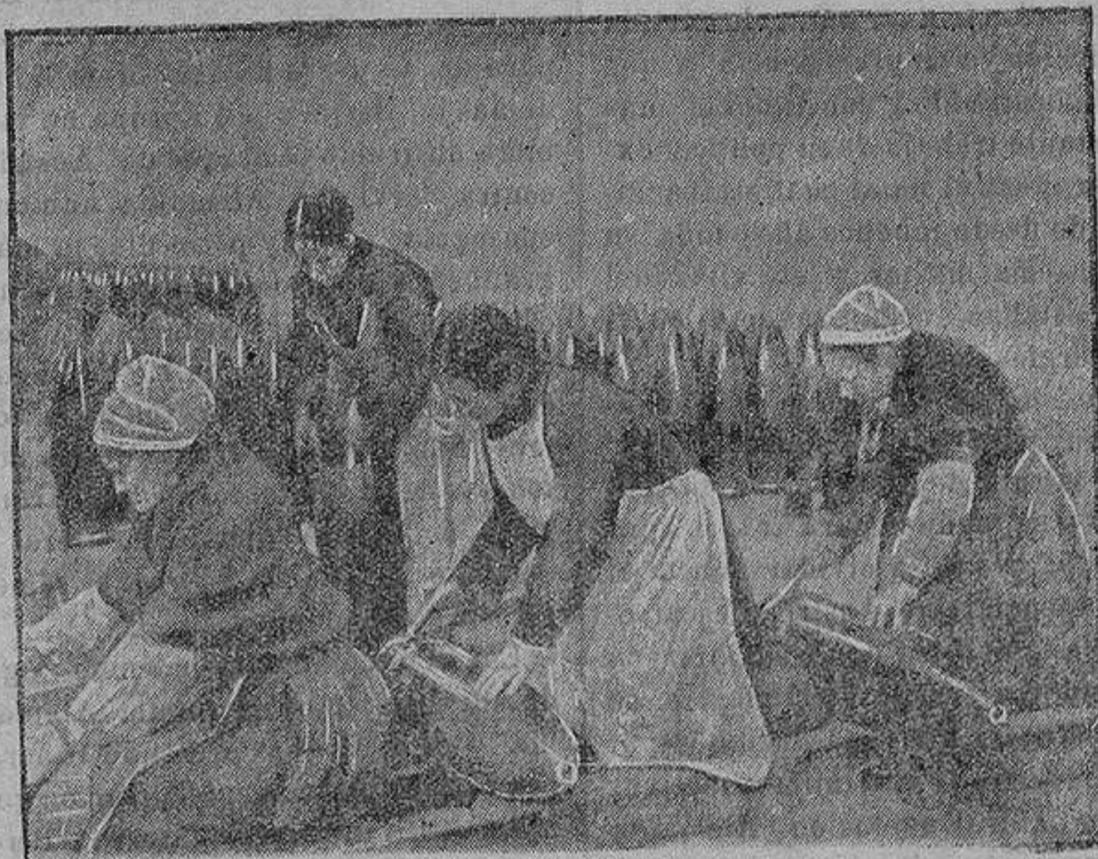
Mujeres de la Gran Bretaña trabajando en los obuses

Efectivamente, así creo que debería ser, porque además de experimentar