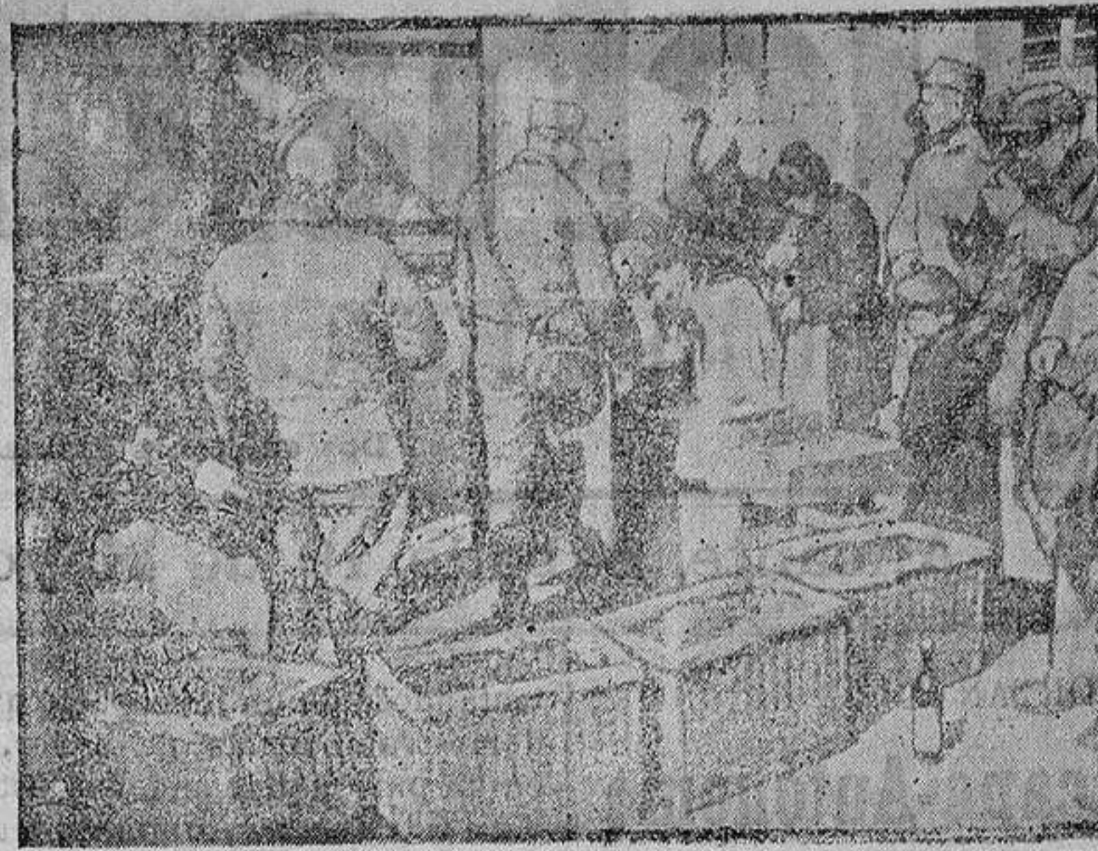
Reparto de víveres en un pueblo reconquistado

En el Centro de la Glorieta se apiña la gente para oír la Banda de música, que instalada en una verdadera gruta de ramaje recrea al público de media en media hora.