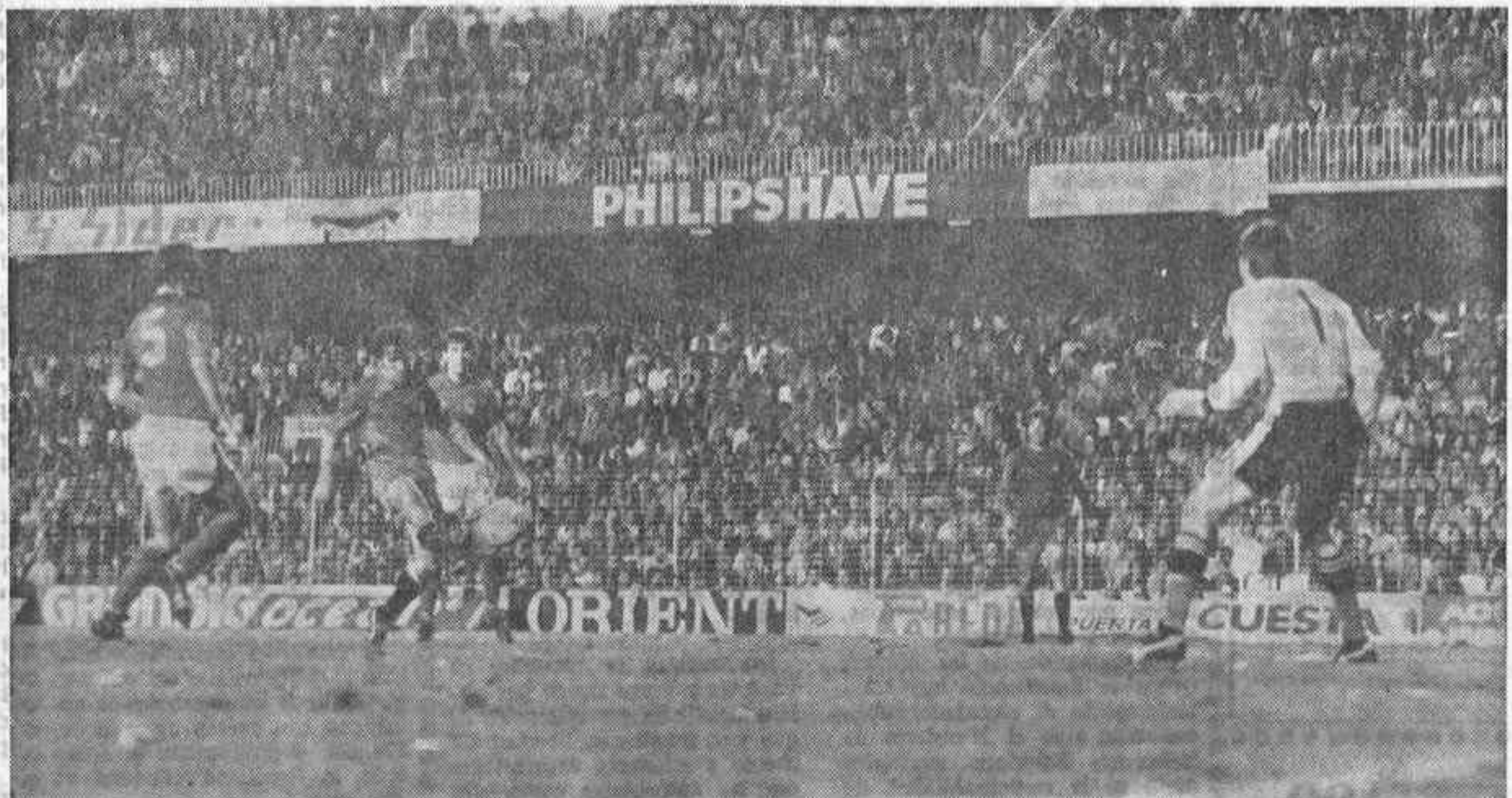
paña, mantener hasta el final esta mínima diferencia. Bueno, pues así ocurrió. ¡Increíble!