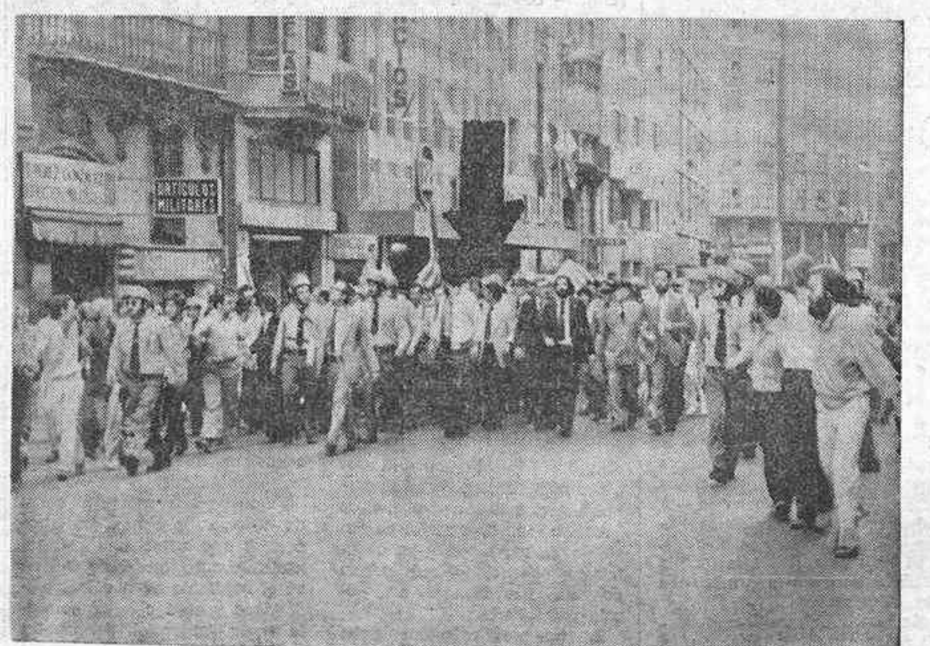
VALENCIA. — Con la presencia de una vociferante y agresiva multitud y con notable retraso, debido a la previa quema de las banderas del balcón del Ayuntamiento, se celebró la jornada conmemorativa de la conquista de Valencia por el Rey don Jaime. Durante la misma se registraron varios incidentes. En la foto, en medio de una fuerte protección policial el alcalde de la ciudad regresa al Ayuntamiento.