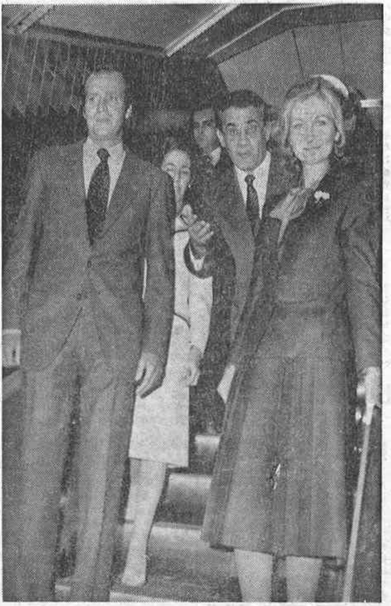
MADRID. — SS. MM. los Reyes, don Juan Carlos y doña Sofía, inauguraron ayer mañana el tramo de ferrocarril metropolitano Cuatro Caminos-Pacífico, correspondiente a la línea VI, denominada de circunvalación, y que cuenta exactamente 7.217 metros. Acompañaron a SS. MM. en el acto de inauguración y posterior recorrido por las instalaciones el ministro de Transportes y Comunicaciones, Salvador Sánchez Terán, y los informadores periodísticos.