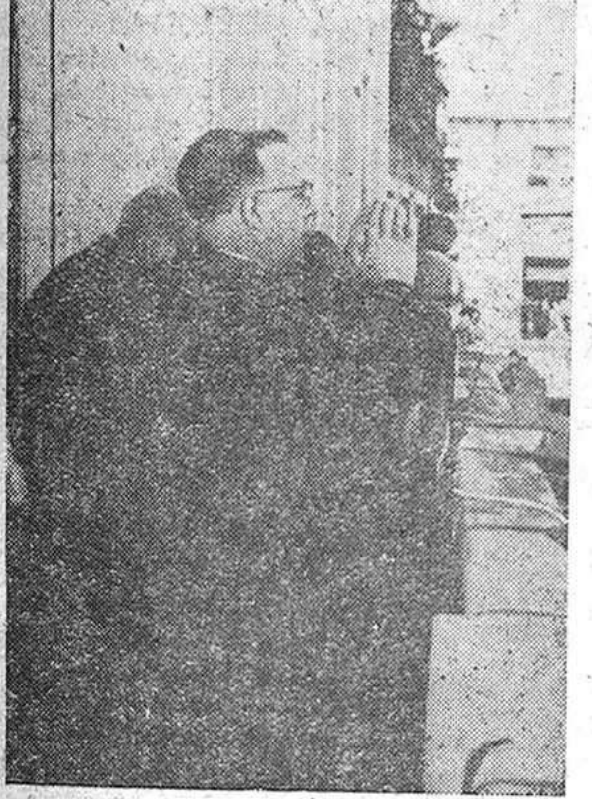
El presente reportaje gráfico, debido a la cámara de nuestro fotógrafo «Andrada», recoge diversos aspectos del cálido y brillante recibimiento tributado en el día de ayer por nuestra ciudad al obispo de la diócesis, excelentísimo y reverendísimo señor don Lorenzo Bereciartúa Balerdi en su primera visita oficial a la capital de la provincia.