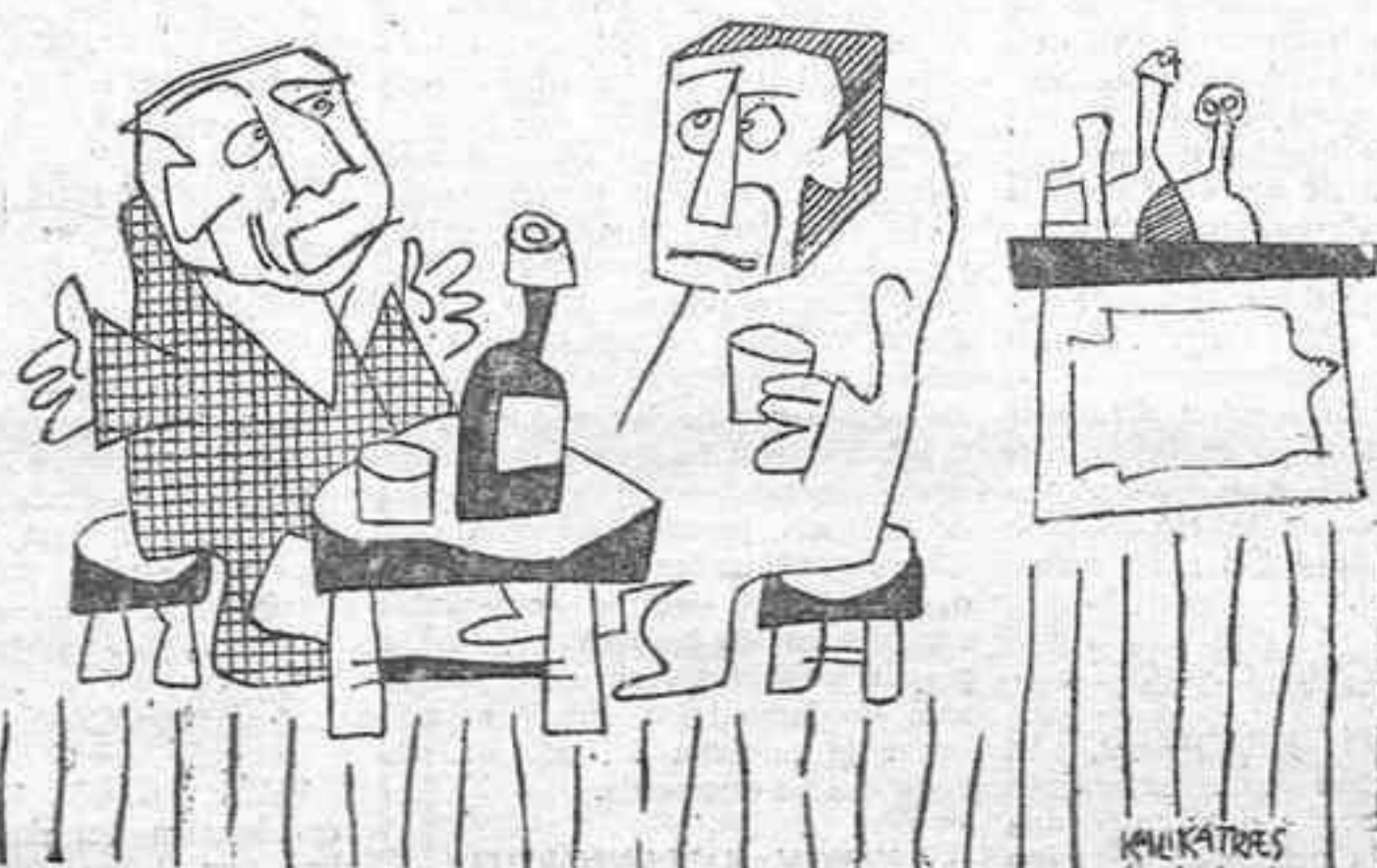
—Lo que más rabia me da de los árbitros no es que algunas veces se equivocan, sino que algunas veces aciertan.