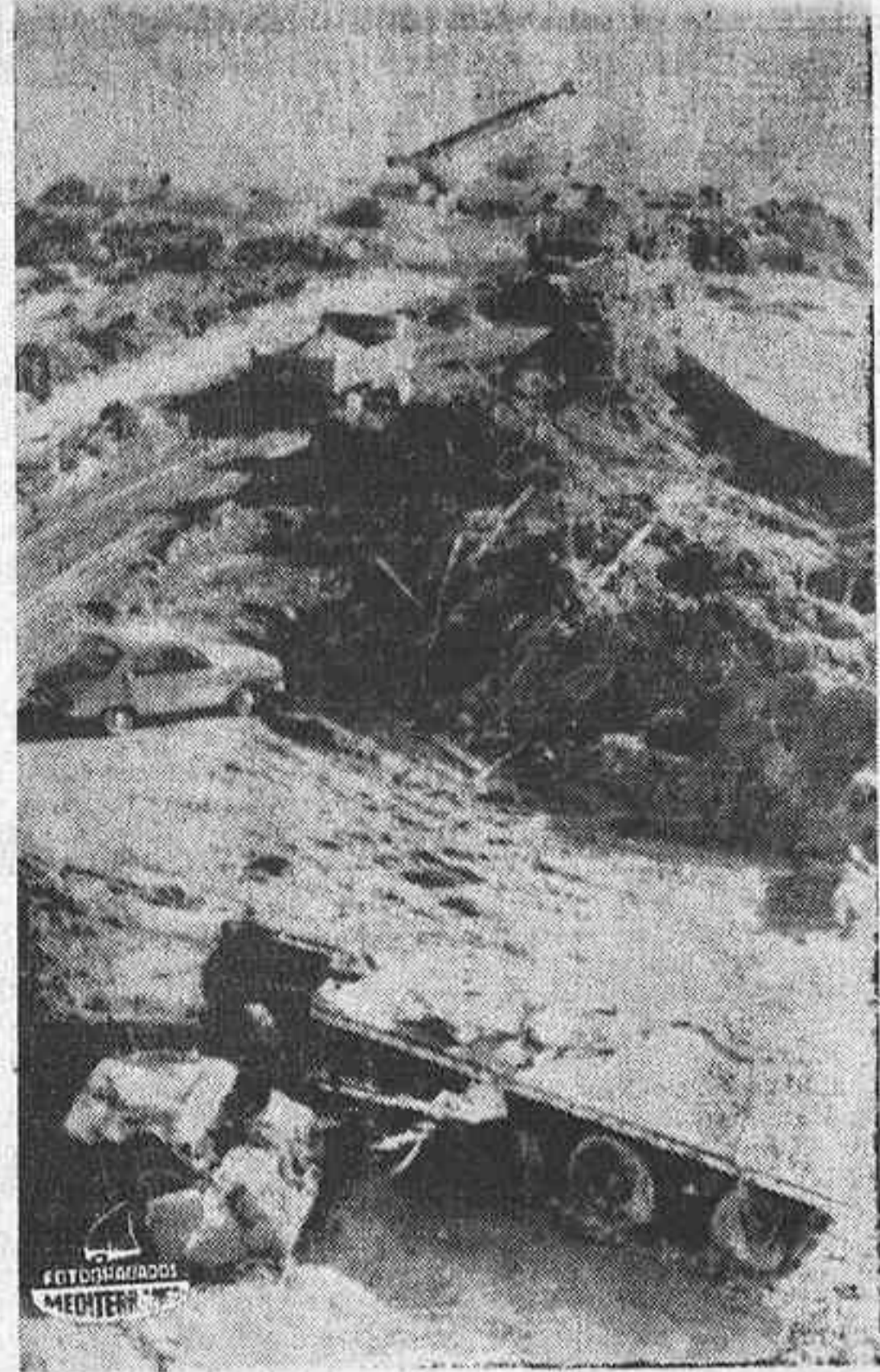
SAN FELIU DE LLOBREGAT (Barcelona). — Estado en que ha sido encontrado el camión que se precipitó por el Puente de San Feliu, en el momento en que este se hundía. El ocupante u ocupantes no han sido encontrados y la cabina se encontraba vacía. Por otra parte se han iniciado ya los trabajos para reparar el puente mientras se construye otro provisional al lado del mismo.