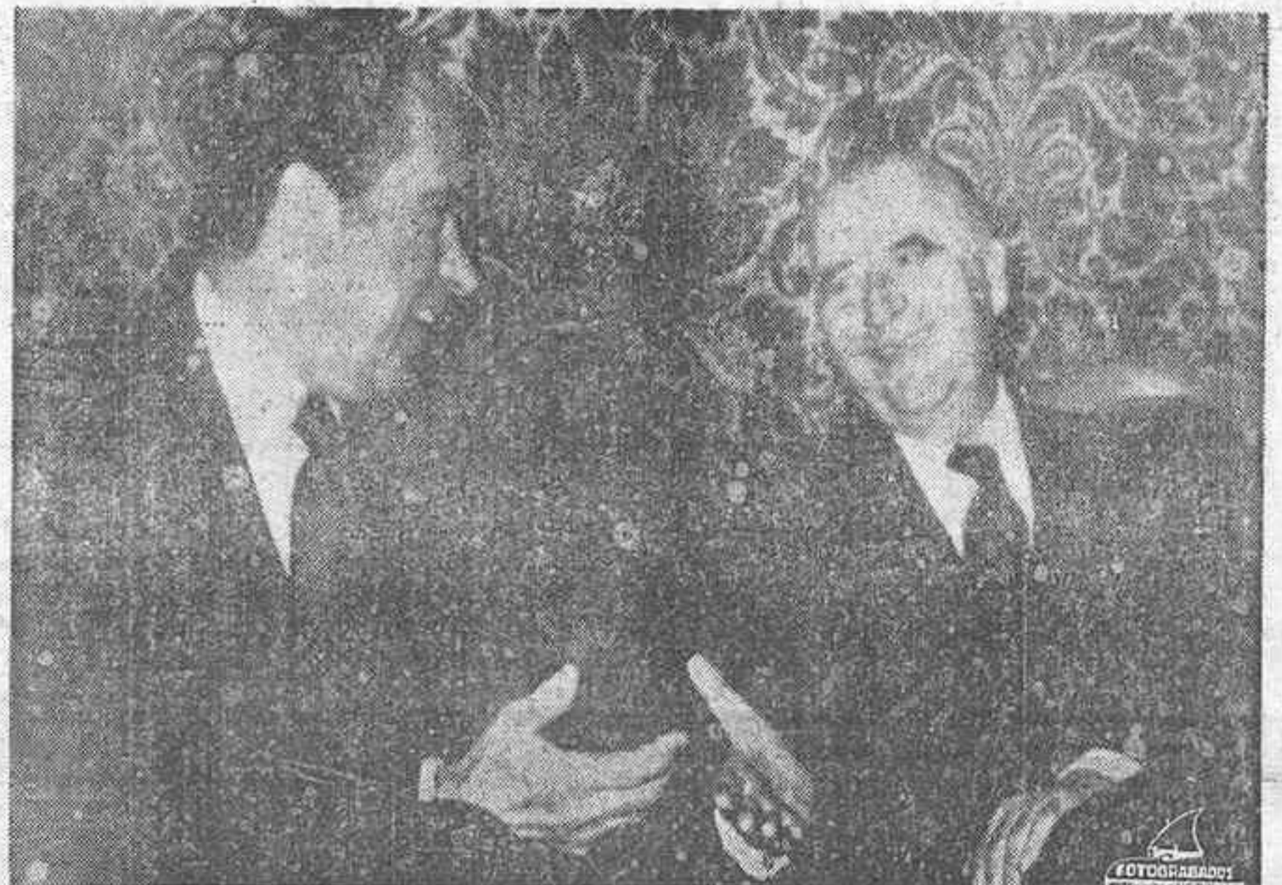
ANGRA (Isla de Terceira, Azores).— El Presidente Nixon, de los Estados Unidos y el de Francia Georges Pompidou, durante su primera reunión.

Es de esperar que ambos presidentes prosigan hoy sus forcejeos referentes a la delicada crisis del dólar y el problema de las barreras aduaneras.