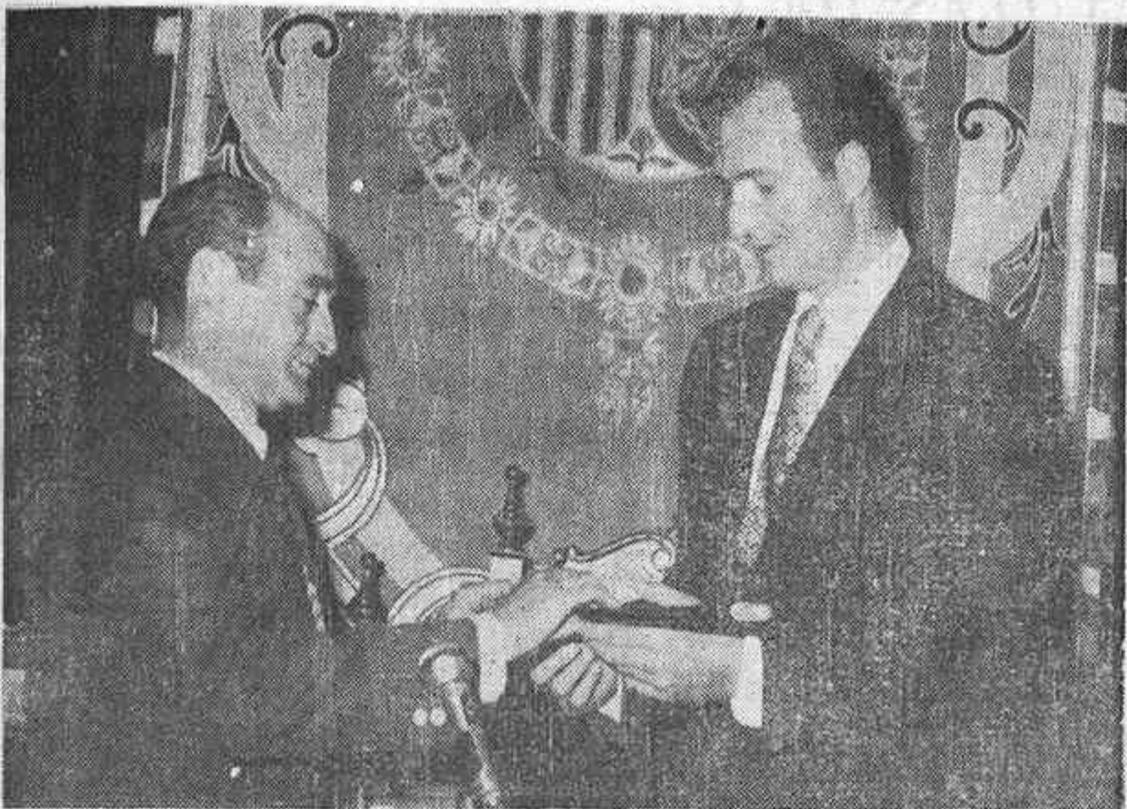
El Príncipe de España ha sido objeto de un grandioso y popular recibimiento en Ciudad Real y en Almadén. D. Juan Carlos de Borbón presidió la sesión plenaria del Ayuntamiento de Almadén y recibió el bastón de Alcalde honorario, momento que recoge la fotografía.

Presidiendo la inauguración de un grupo de 190 viviendas de tipo social