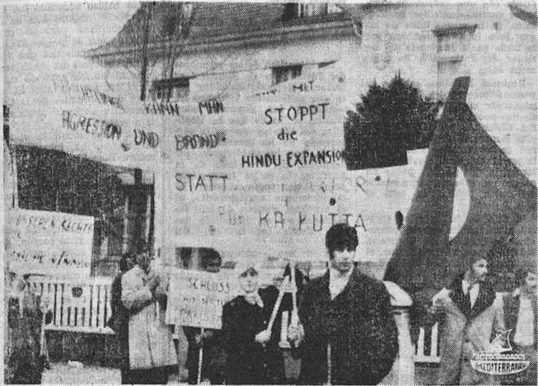
BONN. — Miembros de la Federación Islámica de Estudiantes, se manifestaron en la mañana del lunes frente a la Embajada de la India para protestar contra la «agresión india» y la «expansión hindú».

Parte de la guarnición de la ciudad se ha rendido