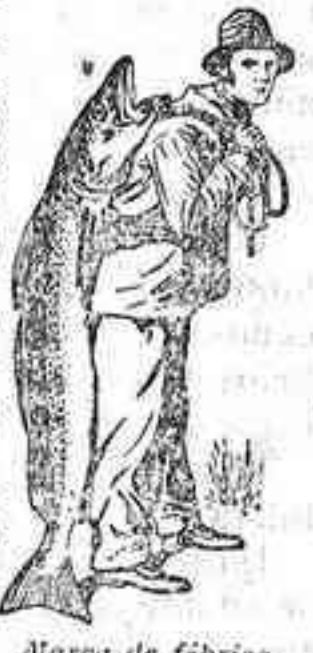
Marcas de fábrica.