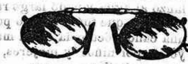
Lentes o Gatas de CRISTAL ROCA, 5 Pesetas.

Gemelos prismáticos, diferentes aumentos, de teatro, desde 10 pesetas. Impermeables, brújulas, barómetros, barómetro y termómetro tallado, a 15 pesetas. La casa que más relojes de torre ha puesto en la provincia y única para la construcción de ruedas dentadas para relojes de pared. Se con-truyen relojes imitación exacta a los INGLESES. PRECIOS SIN COMPETENCIA