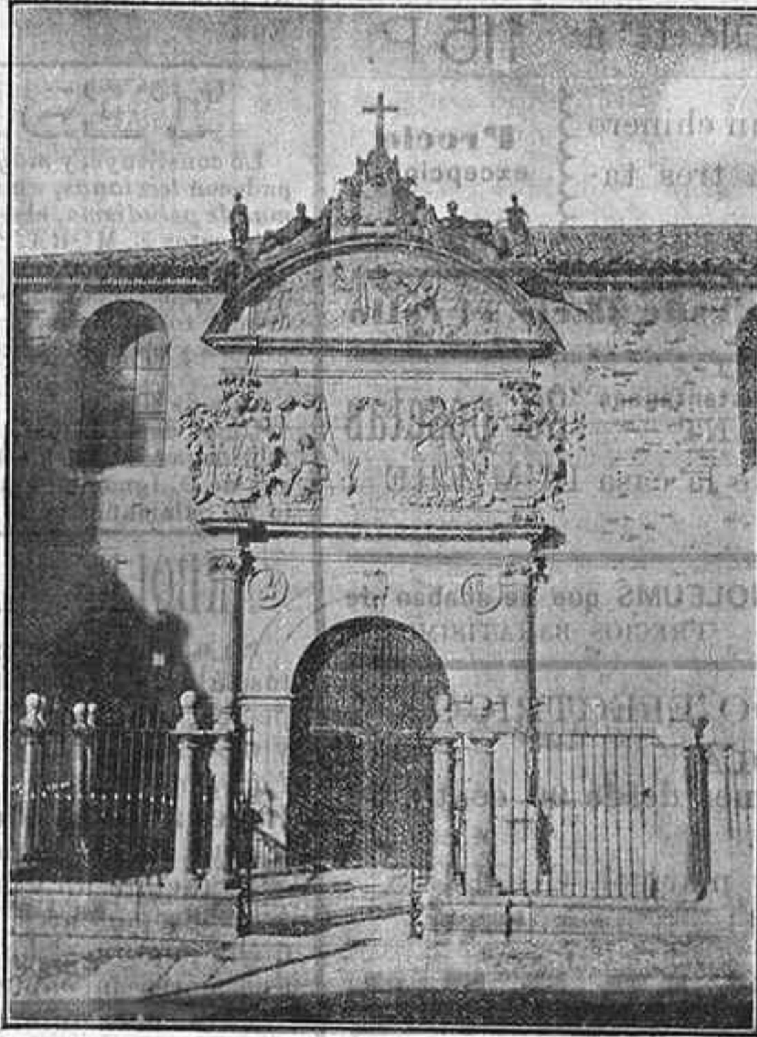
ALBA de TORMES.—Iglesia de MM. Carmelitas

Es, pues, ángel Santa Teresa, el ángel de luz hermosa que cobija con sus alas al Carmelo, que envía sus aromas olorosos al claustro; ángel que parece haber agotado las complacencias de Dios y que puede decirse, después de hacer a Teresa, rompió el molde para que Ella fuese única.