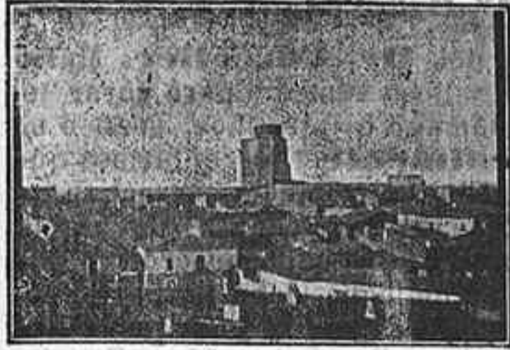
ALBA DE TORMES