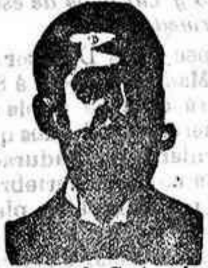
An golo Costanzi Dip. 436, Barcelona

Preparación la más racional para curar la tuberculosis, catarros crónicos, bronquitis infecciosas gripales, enfermedades consuntivas, inapetencia, debilidad general, postración, nerviosa neurastenia, impotencia, enfermedades mentales, caries, raquitismo, escrofulismo etc. Frasco 2'50 pesetas. DEPÓSITO: Farmacia del Dr. Benedicto, San Bernardo 41, Madrid y en la provincia de Salamanca, farmacia del Licdo. Rodilla. - Guijuelo.