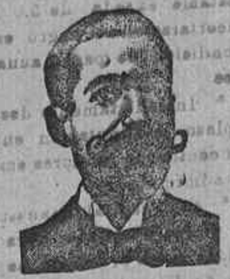
A. SALVATI COSTANZI Diputación, 435, Barcel.