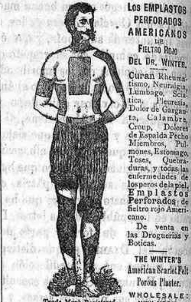
Los EMPLASTOS PERFORADOS AMERICANOS DEL DR. WINTER. Curan Rheumatismo, Neuralgia, Ciática, Dolores de Garganta, Calambres, Croup, Dolores de Espalda Pecho Miembros, Pulmones, Estomago, Toses, Quiebrasuras, y todas las enfermedades de la parte de la piel. Emplastos Perforados de frotto rojo Americano. De venta en las Droguerías y Boticas. THE WINTER'S American Scarf Pelt. Poros Plaster. WHOLESALE: NEW YORK.