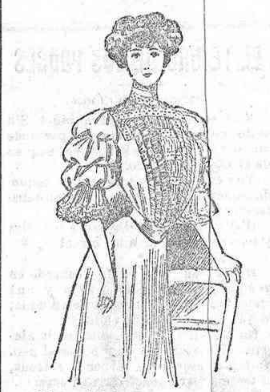
Elegantísima blusa para teatro. Formen el delantero tres volantes de gasa por cada lado, y el centro un plisado, cruzado por tiras de pespunte. Mangas con tres bullones, y gran volante de gasa en el codo.