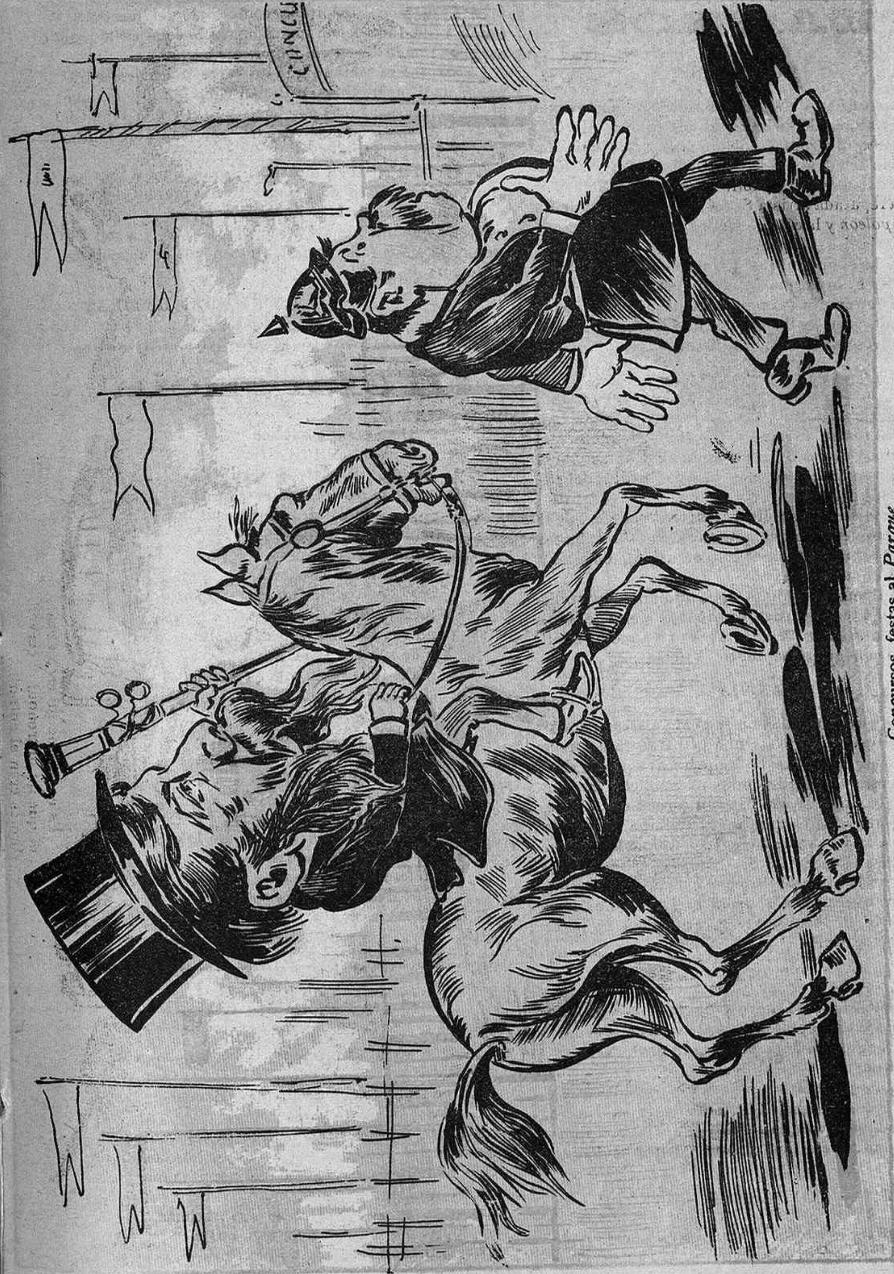
Concursos, festas al Parque y un sens fi de manganillas, tot perque 'l gran Bolad eres hi llunheixi las patillas.