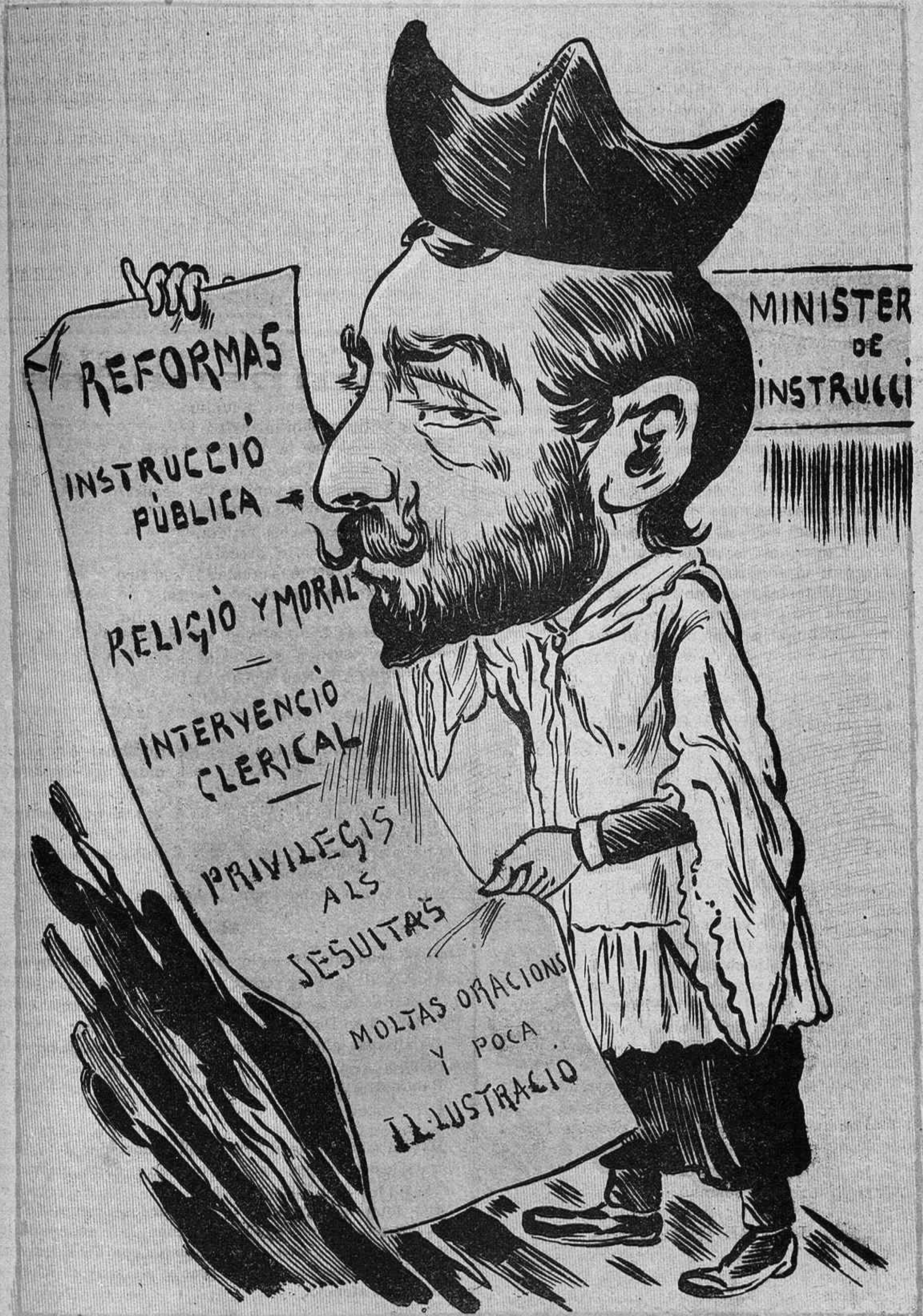
Las lleys del ministre coix las reventa el nou bastaix lumbreira ab posat de moix y qu' es de la crosta de baix .