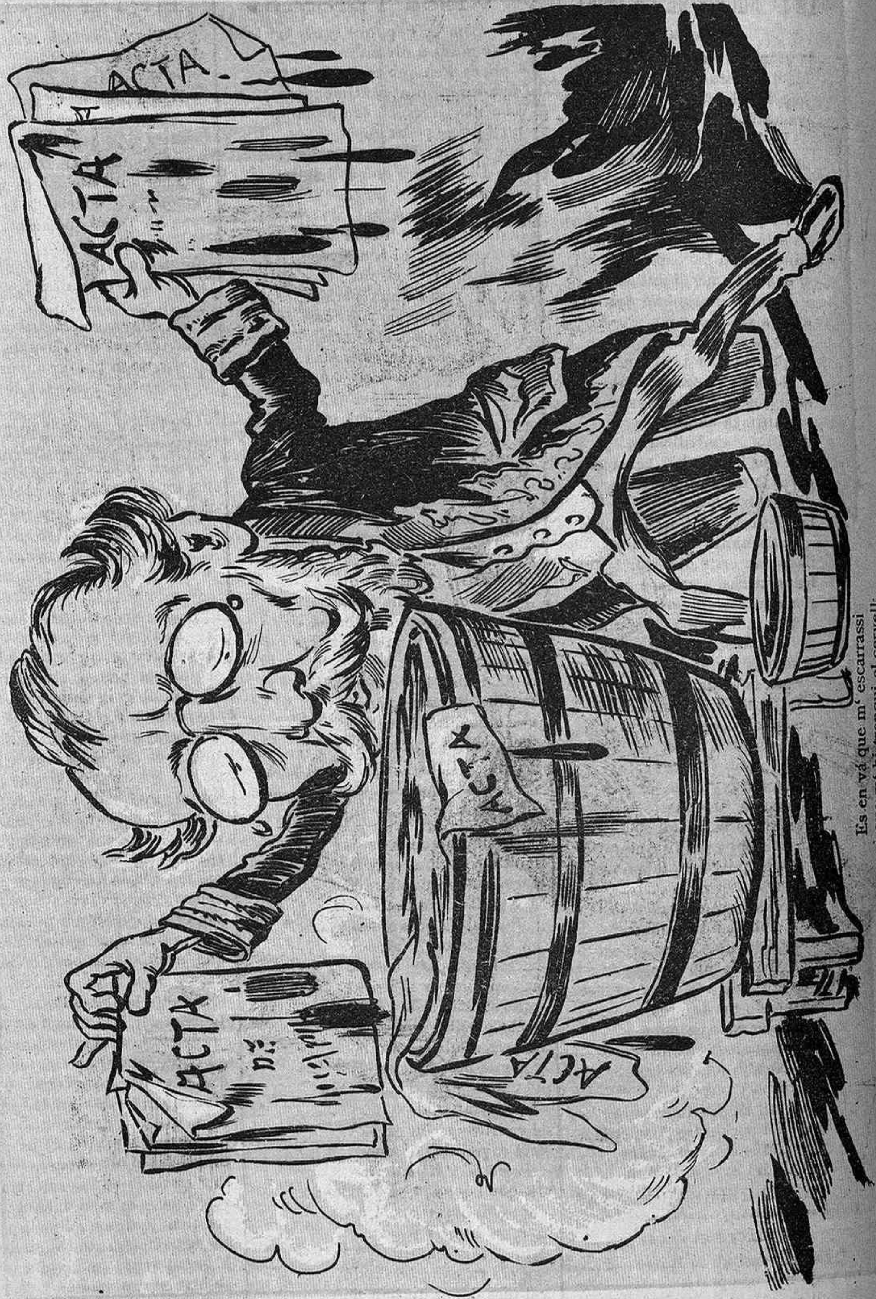
Es en v  que m' escarrassi ni que m' hi trenqui el cervell. brutissim segon el contracte hi.