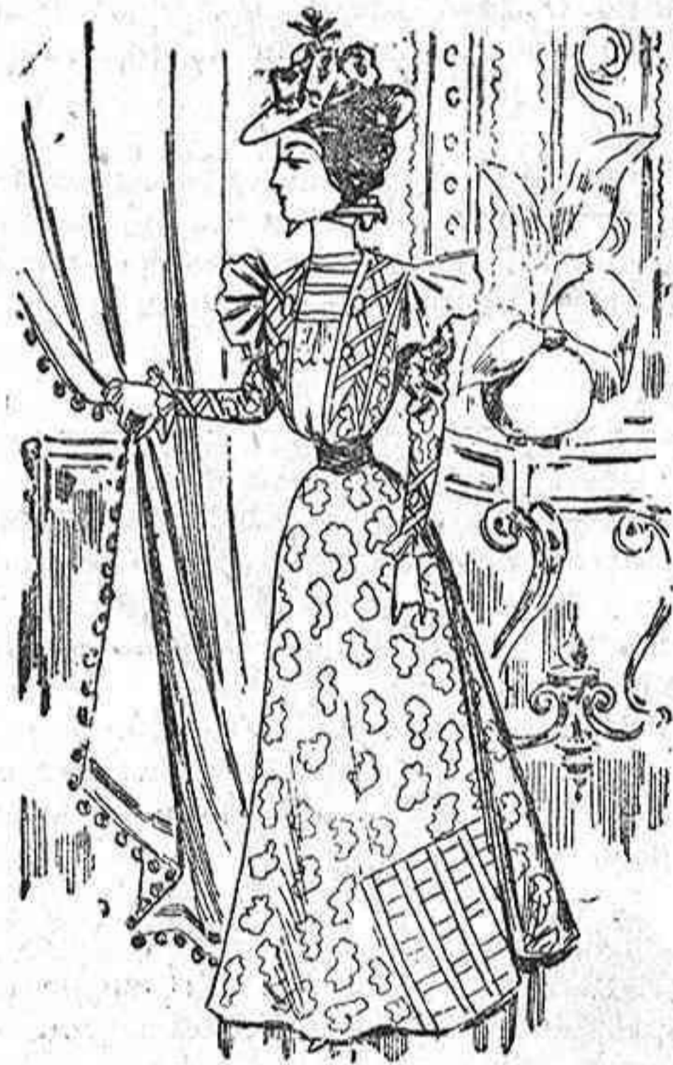
Traje para visita.

Modelo exclusivo para nuestras lectoras, de los Almacenes de EL SIGLO, Barcelona.