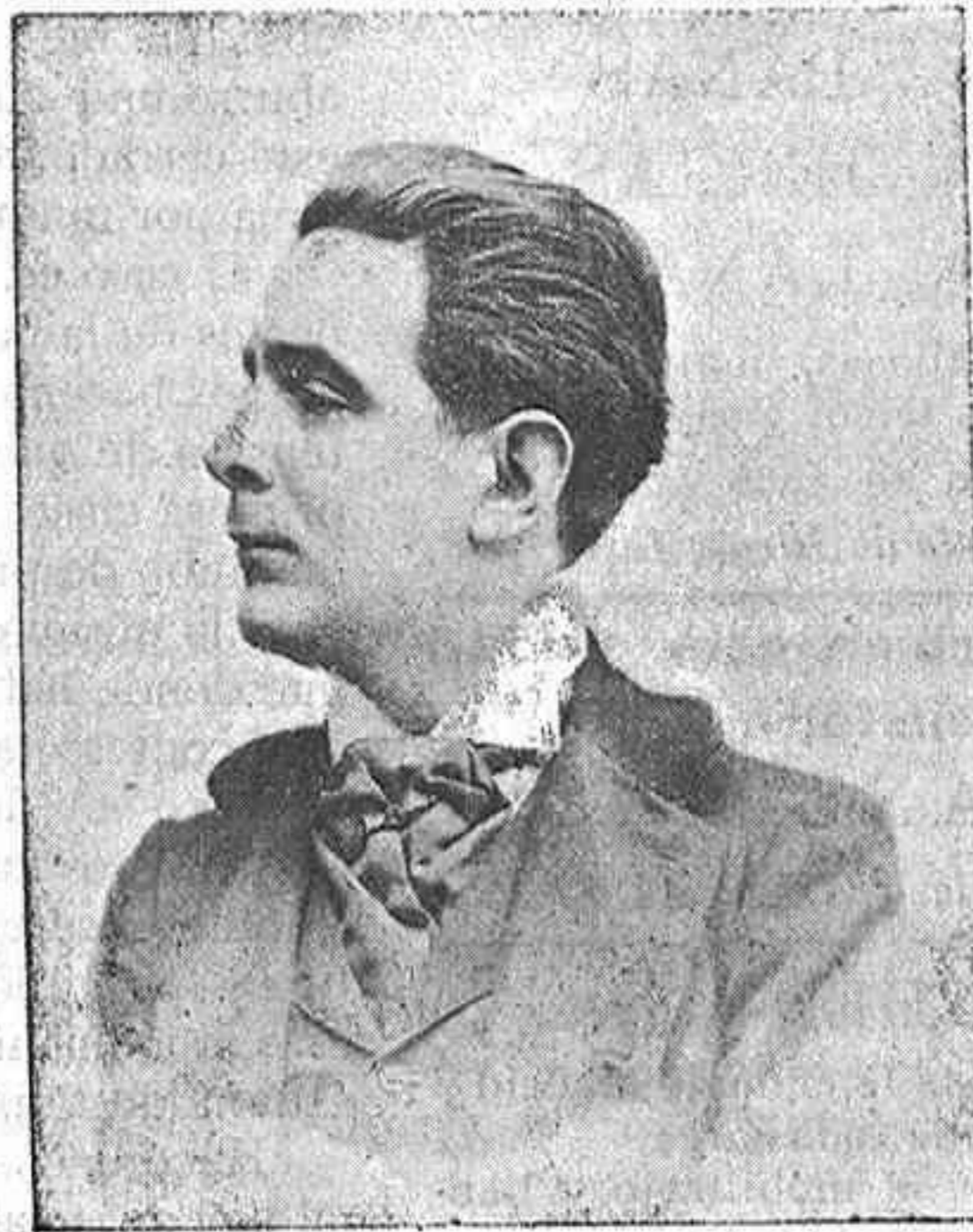
ACTOR DEL TEATRO CÓMICO