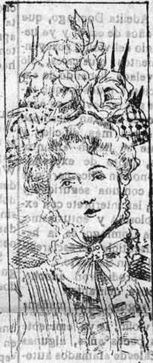
Sombrero para señoritas

Modelos exclusivos para nuestras lectoras, de los grandes almacenes de EL SIGLO , Barcelona.