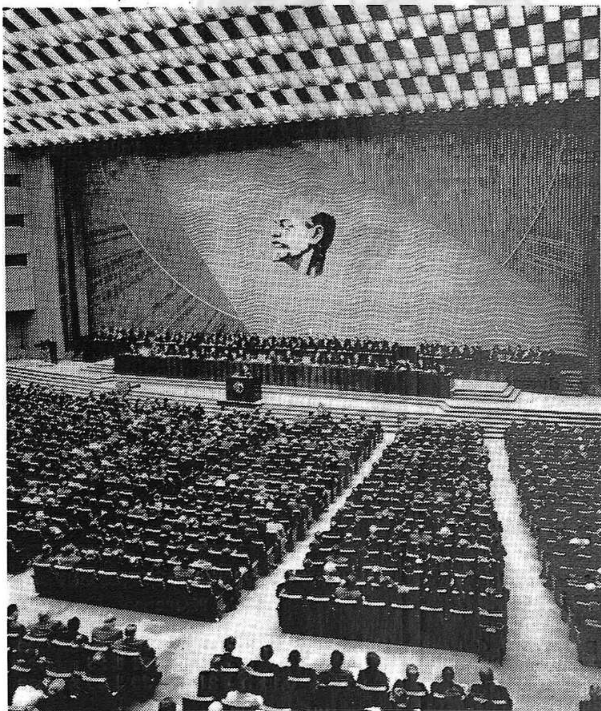
Vista de la sala del Congrés durant una de les sessions.

Durant el VIII Pla es van formar 151 000 metges, 22 000 més que en el quinquenni precedent. Es van inaugurar 60 nous centres d'ensenyament superior, incloses 9 universitats, i es va donar ensenyança mitja completa a un 80 % dels alumnes que van acabar la vuitena classe. El nombre de treballadors de la ciència va augmentar un 40 % i és actualment de gairebé 930 000. A finals de 1970 el 75 % dels treballadors de les ciutats i més del 50 % dels del camp tenien instrucció mitja o superior.