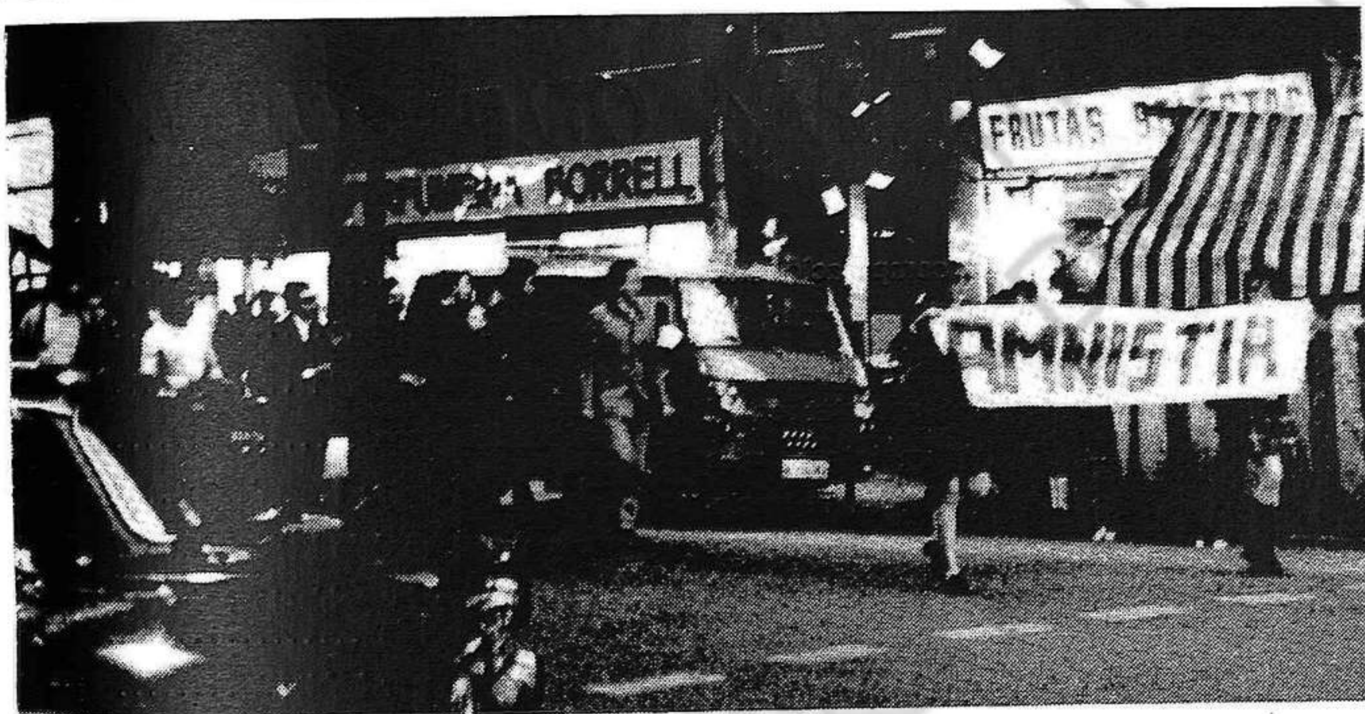
La manifestació arrenca : Barcelona, Mercat de Sant Antoni

Dilluns i dijous, tarda i vespre, emissions en català.