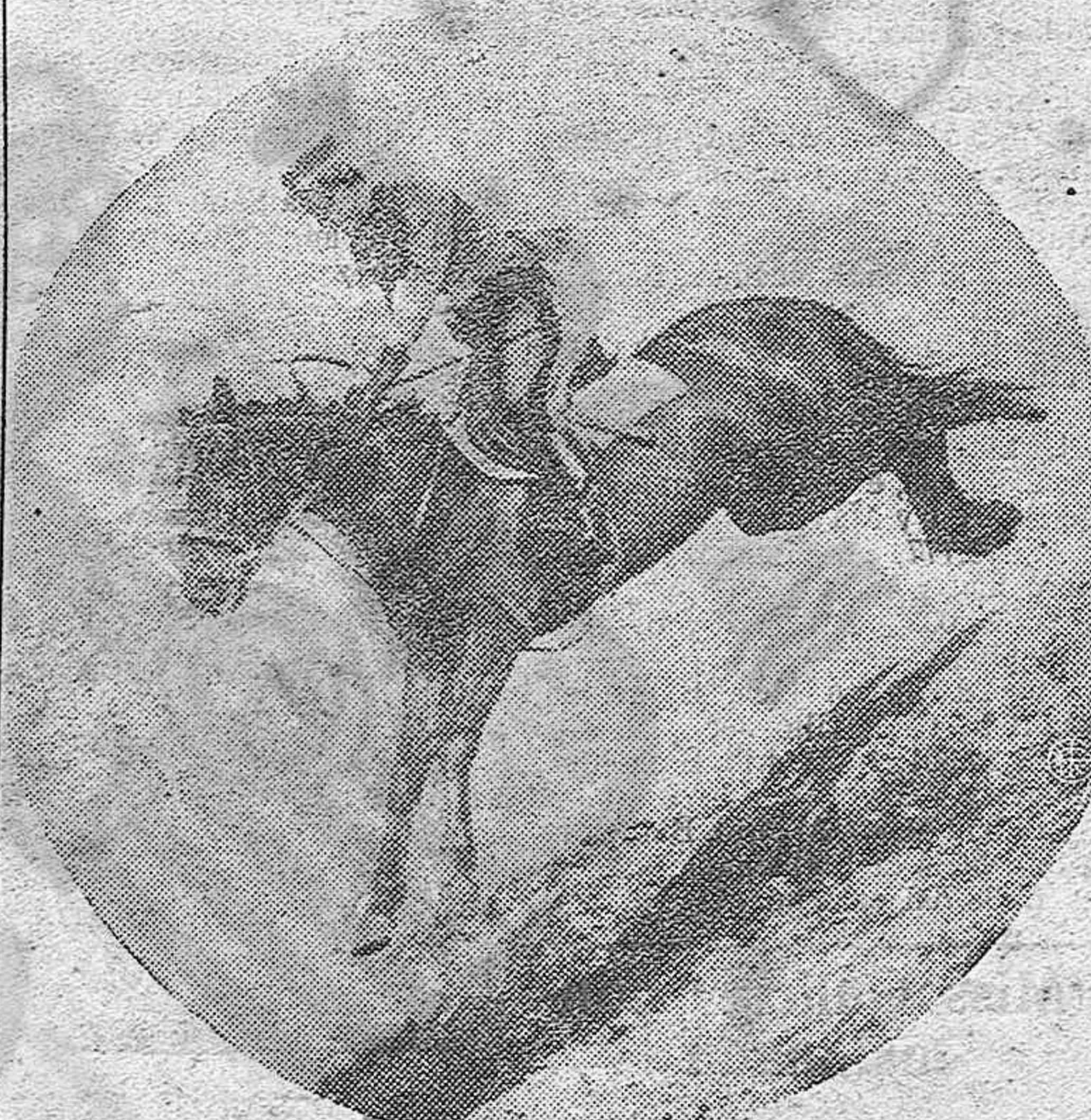
De la exhibición anual de la célebre escuela de equitación italiana de Tor-Di Quinto: Un oficial del ejército italiano en un difícil momento de prueba.