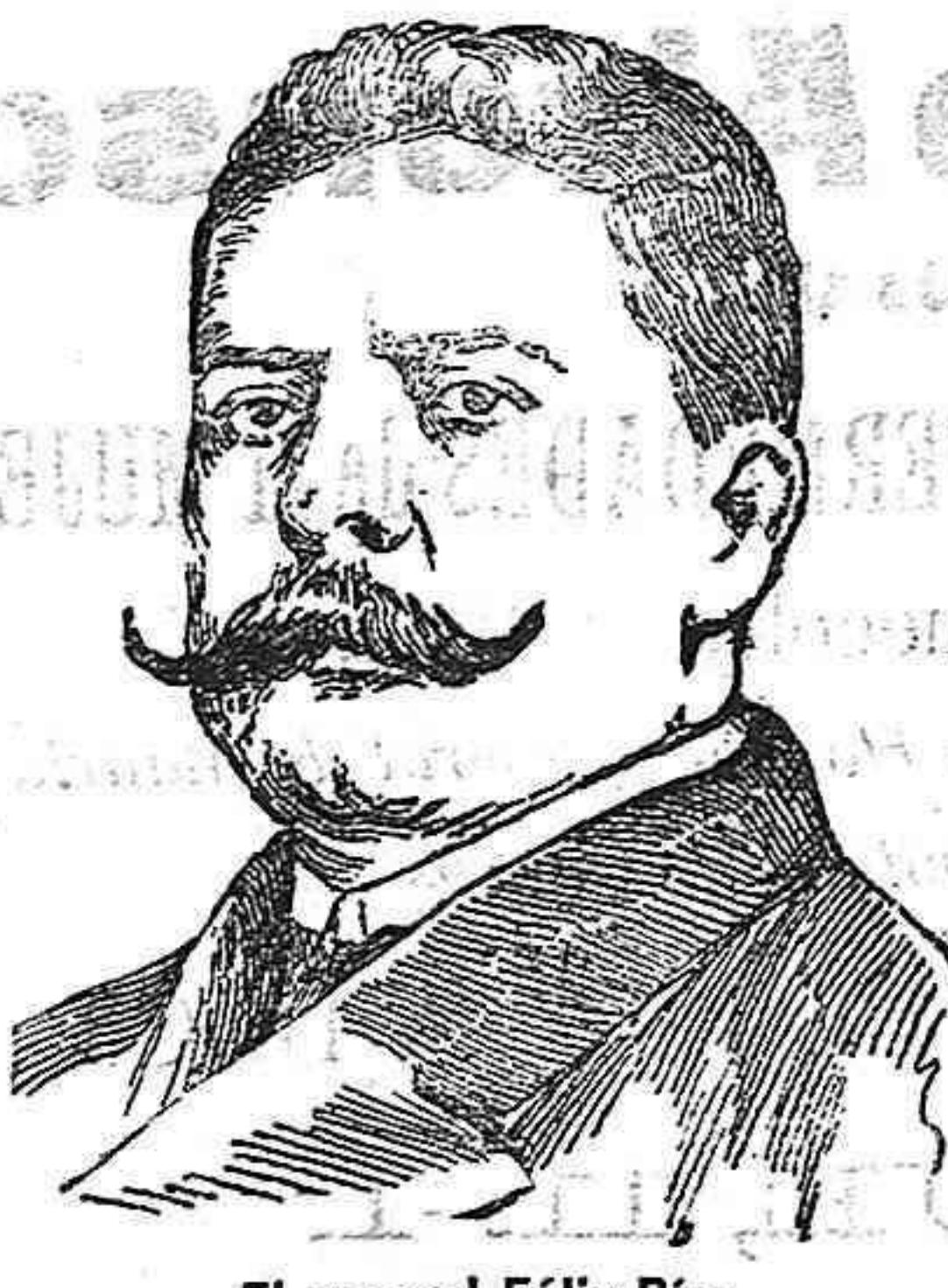
El general Félix Díaz

Desde hace más de un mes se ha en Veracruz al frente de un gran contingente de fuerzas, el general Félix Díaz, sobrino de don Porfirio. El referido general, salió hace algún tiempo de Nueva Orleans, con armas y municiones, desembarcando en Tuxpan, cerca de Méjico. Al tener noticia de su llegada, comenzaron a alistarse bajo su mando los verdaderos militares de carrera, de la época de D. Porfirio Díaz, los cuales, después de organizar sus fuerzas y bagajes a la perfección, se preparan a salvar a Méjico de la anarquía y la miseria en que está sumido, después de este intenso período revolucionario. Nombrado Félix Díaz por sus compañeros general en jefe de las tropas, ha entrado en Méjico con el siguiente lema: «Paz y Justicia». En una proclama que ha dirigido al pueblo, ofrece restablecer la Constitución del 64 que fué abolida por Carranza; ofrece también el más absoluto respeto para la vida, la propiedad y el culto. En todo Méjico ha sido recibido con agrado el manifiesto de Félix Díaz, pero donde más partidarios ha tenido ha sido en Caracas, pueblo natal de D. Porfirio Díaz. ¿Restablecerá este nuevo caudillo la tranquilidad en Méjico? Por la grandeza y el bienestar de aquel bello país así lo deseamos, y con nosotros España entera, que ha visto con dolor, esta larga etapa de guerras fratricidas, que acabarán por aniquilar aquel floreciente Estado americano.