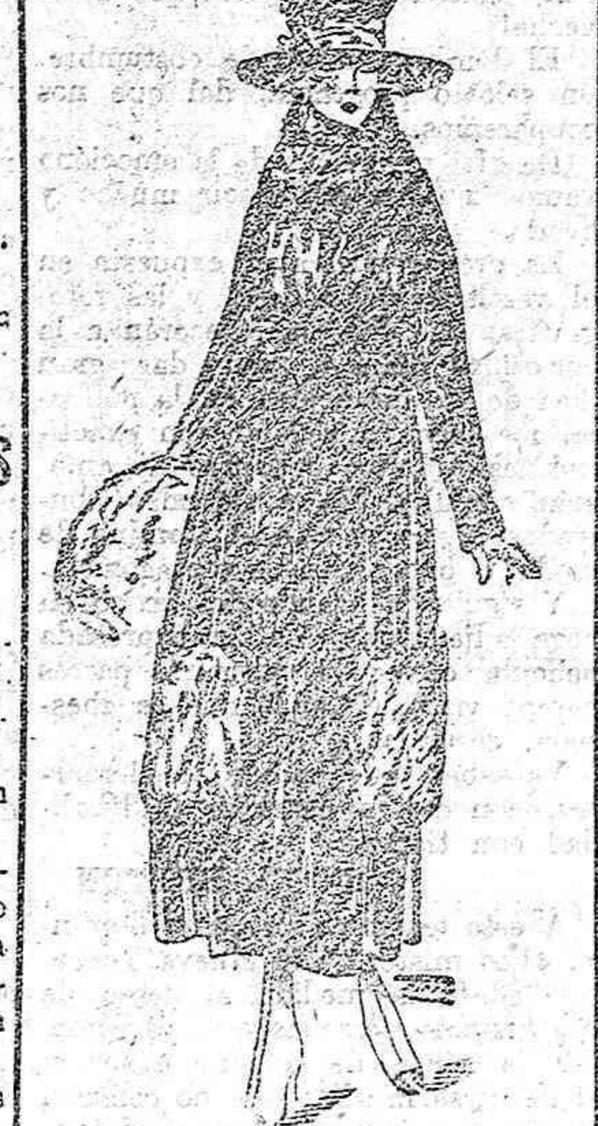
Descripción del modelo Elegante vestido-abrigo de terciopelo negro o tonos muy oscuros, adornado con piel y grandes botones de fantasía a los lados del cinturón, abrochándose éste por el izquierdo.

Frente macedónico.—Ha aumentado la actividad del fuego entre Vardar y el lago Doiran.