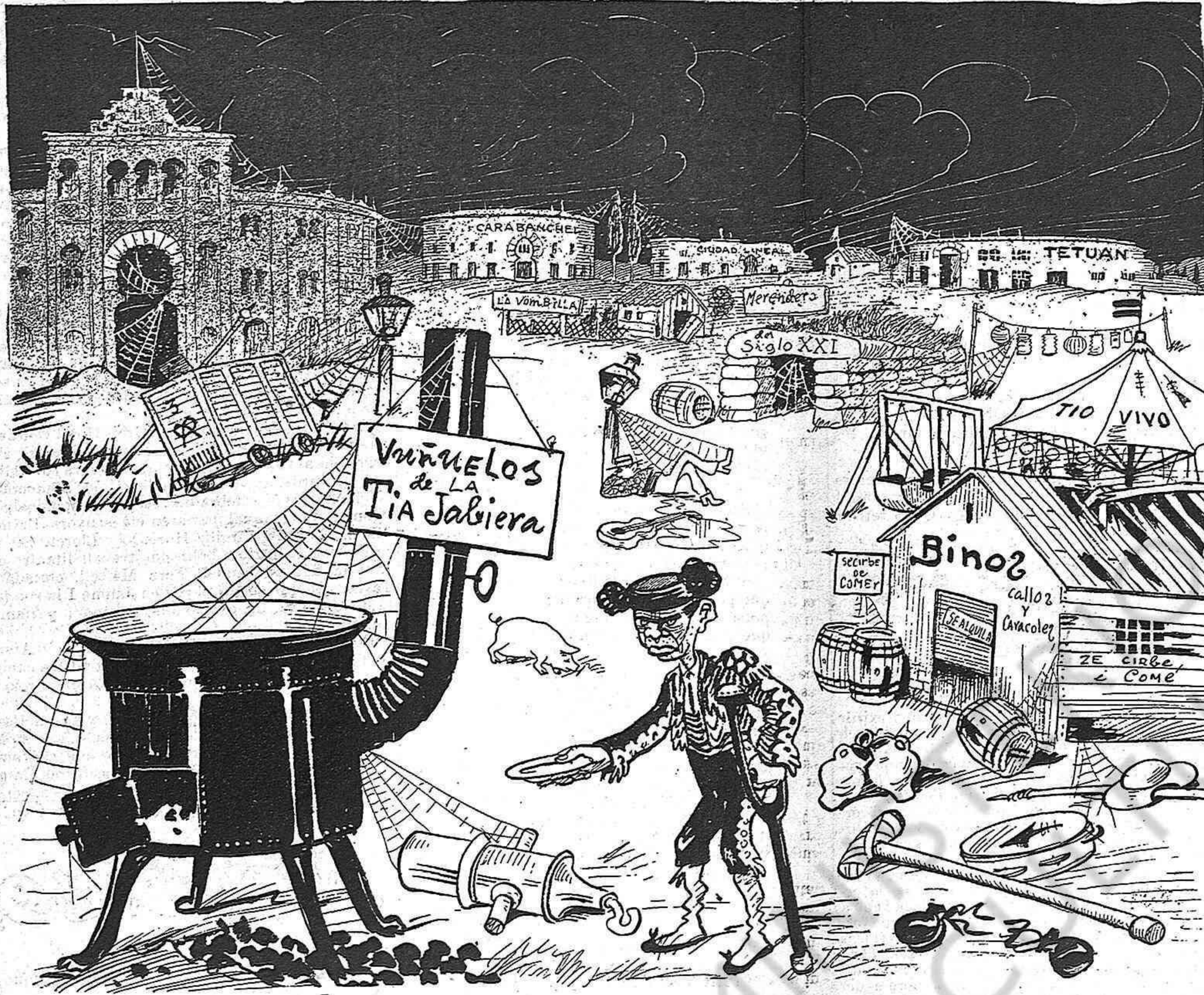
«La industria de Madrid languidece de una manera alarmante.»