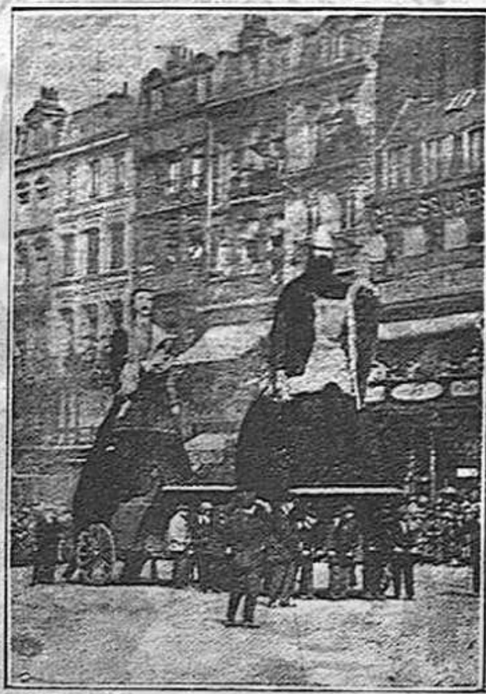
Els gegants de Lille

En tot França, acabada la guerra, hi ha hagut un resorgiment general, natural reacció de les penallitats sofertes durant els quatre anys de guerra. Allí on és més accentuat aquest resorgiment és