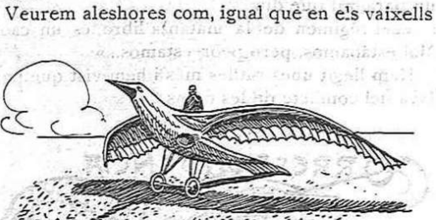
Aeroplà en forma d'ocell

Serà a fè curiós sentir en lloc de: construeixin un aeroplà, un monoplà, un hidro-avió; facin un pinçà, un passarell, o una cadenera o anem a sapiguer si un canari, amb flauta i tot. En quant a la gasolina, barrejant-hi una mica d'essència, llestos.