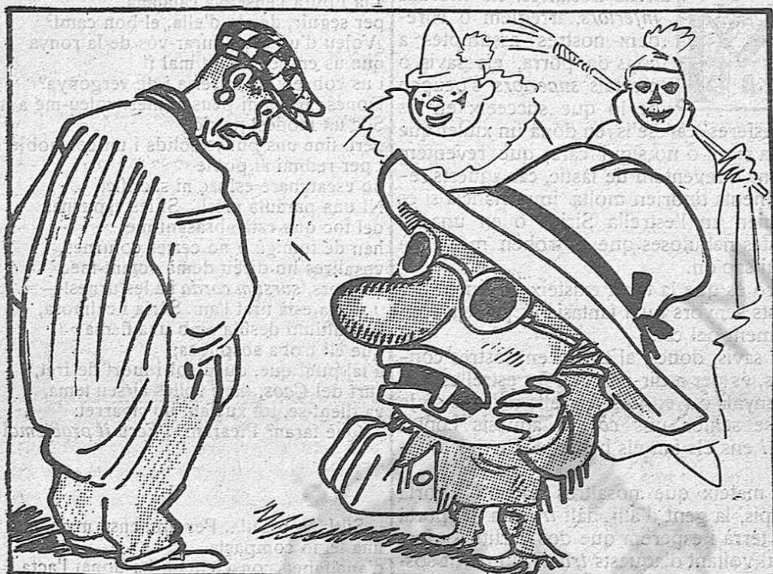
- Que no me conoces? - Et tinc present d'alguna altra vegada...