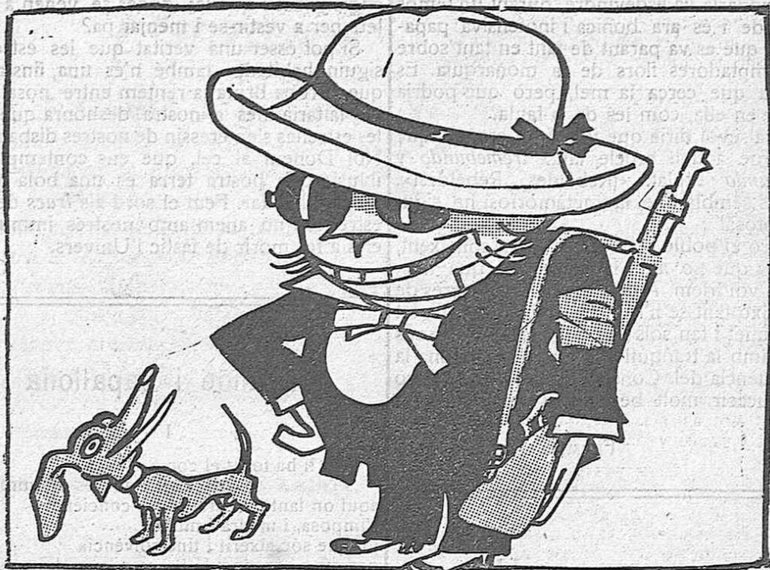
- Per anar de cacera - de matinet, m'anirà de primera - aquest barretet.