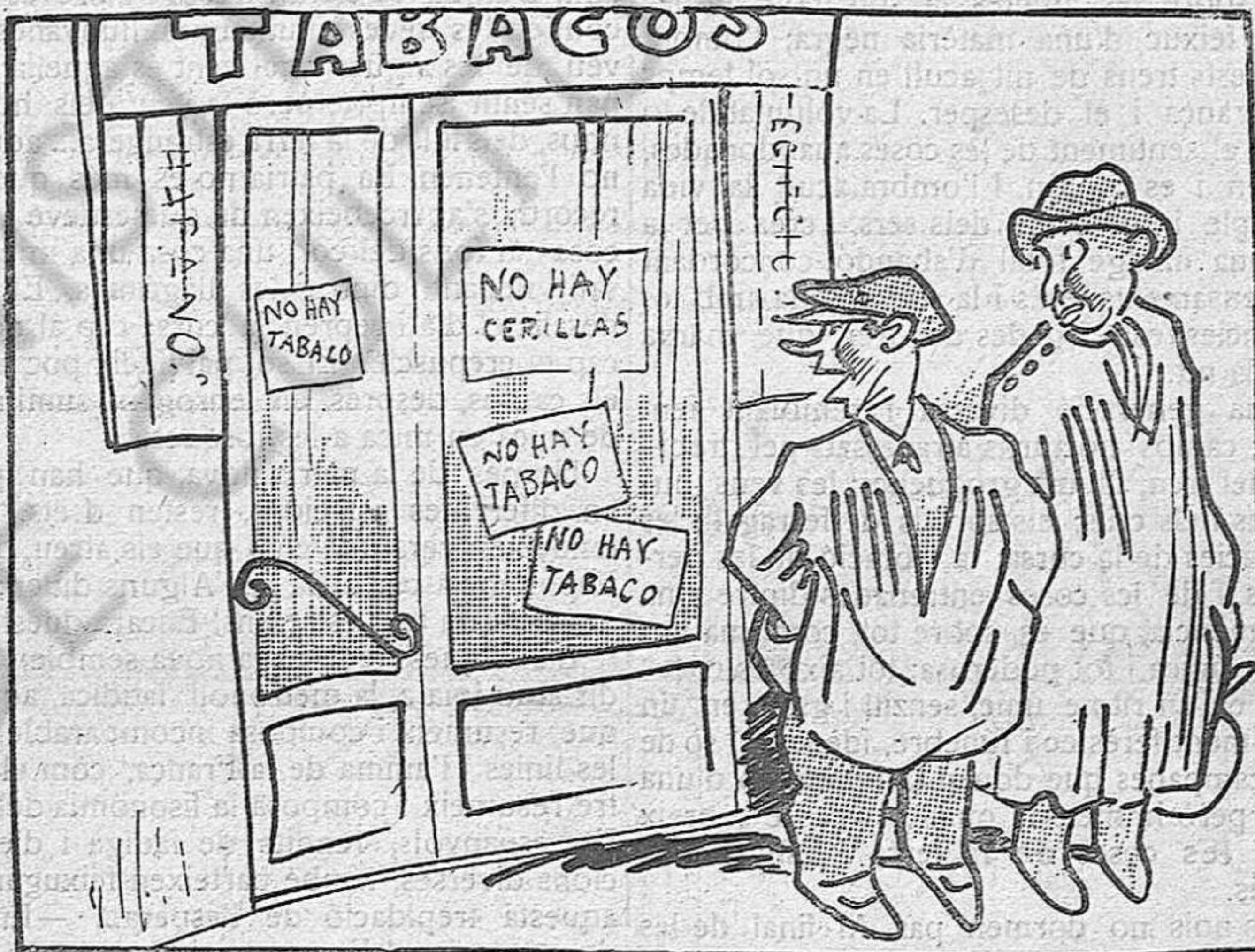
- Apa, anem, Mitja-cerilla! - Oh, ja ho dius tu.. Ni mitja no n'hi ha'...

Saragateros, els lligaires. Mai dirieu on van montar una oficina electoral? Al saló de ball «Iris Park». Així, anticipant-se a la victòria, de passada que miraven si eren a les llistes, arrambaven amb una raspeta del barri i ballaven un fox-trot.