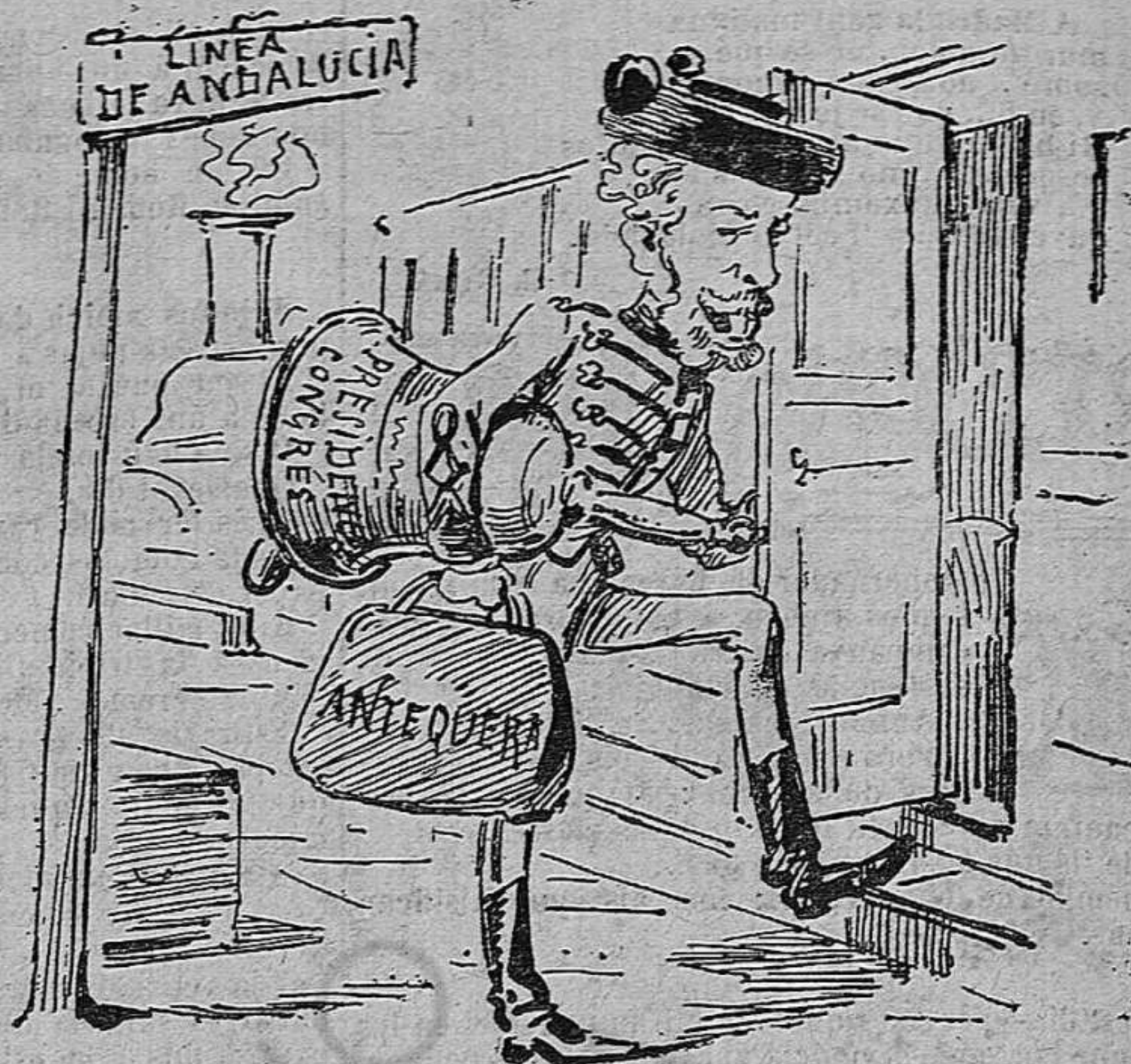
A Antequera 'l goig m' espera: salga el sol por Antequera.