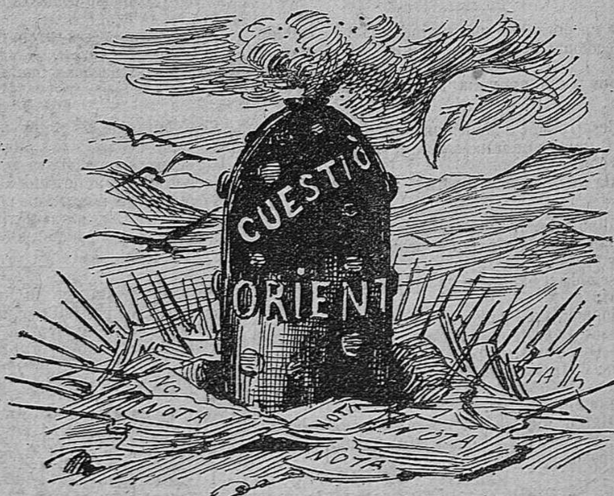
Ja fuma com una estopa la bomba recarregada... Quan reventi, ¡adéu Europa!