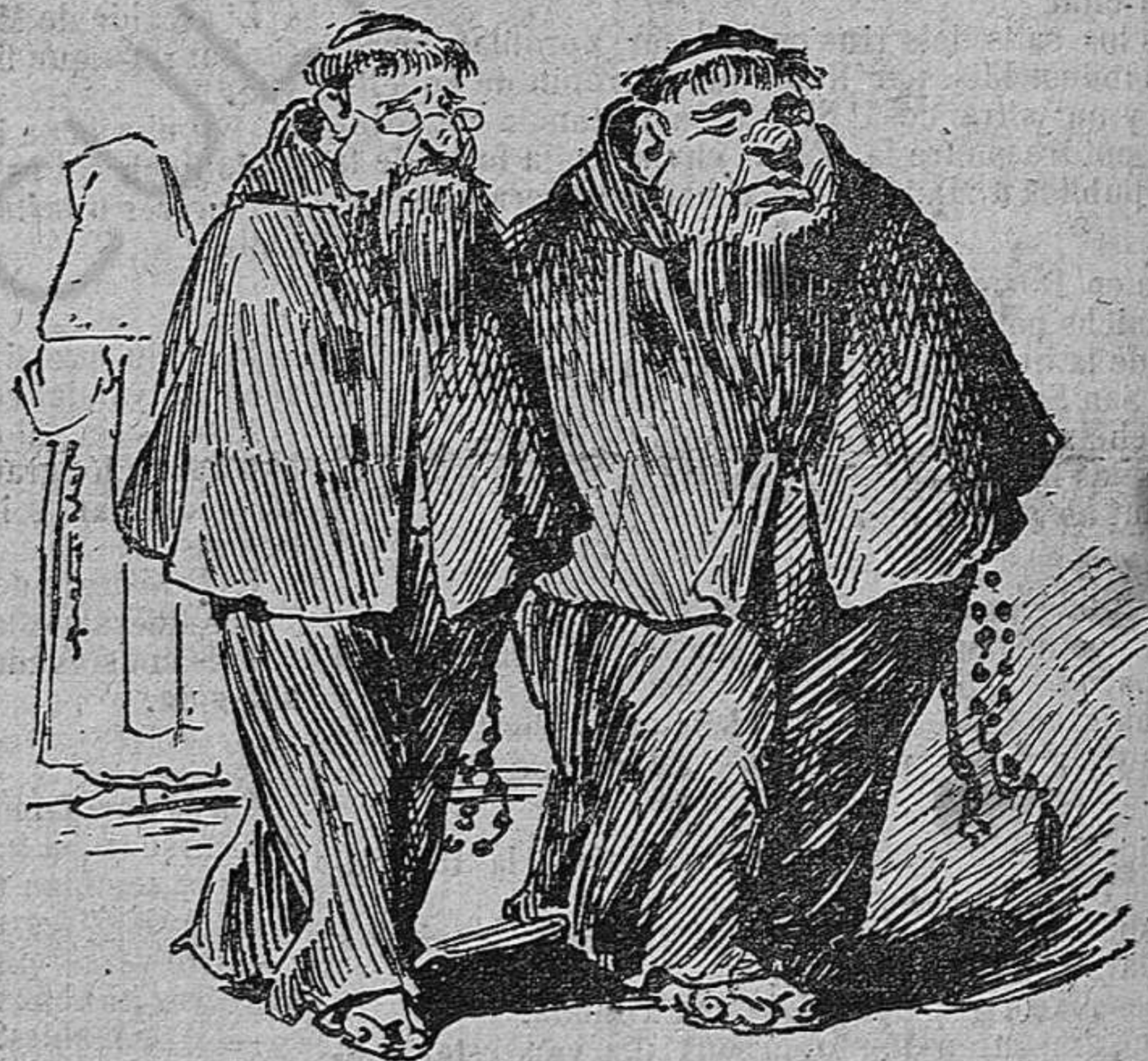
Lletjos, pudents y greixosos. ¡Vaya uns temps més deliciosos!