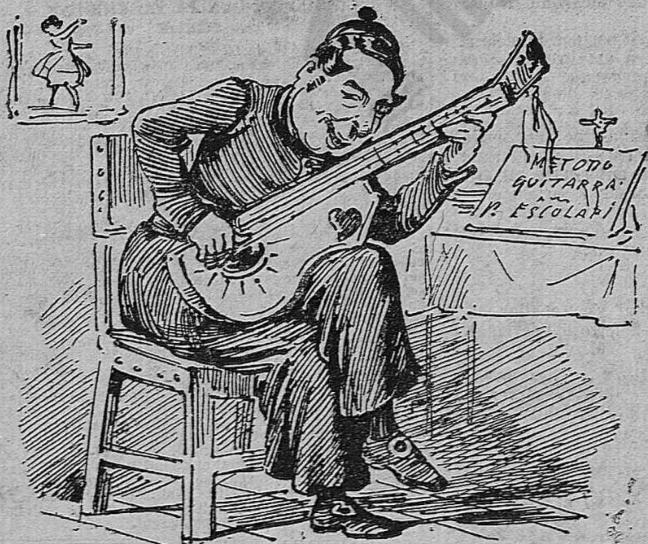
Guitarra de mitja caixa un escolapio la inventa y un cònservador l' aixafa.