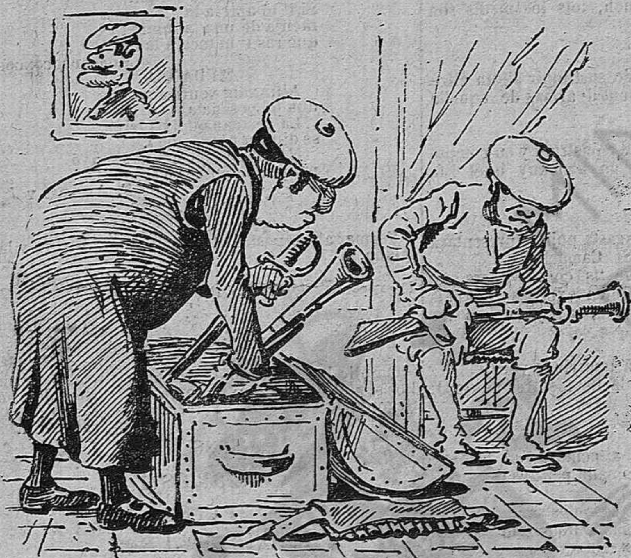
Diu que prompte tindré feyna: torném á netejar l' eyna.