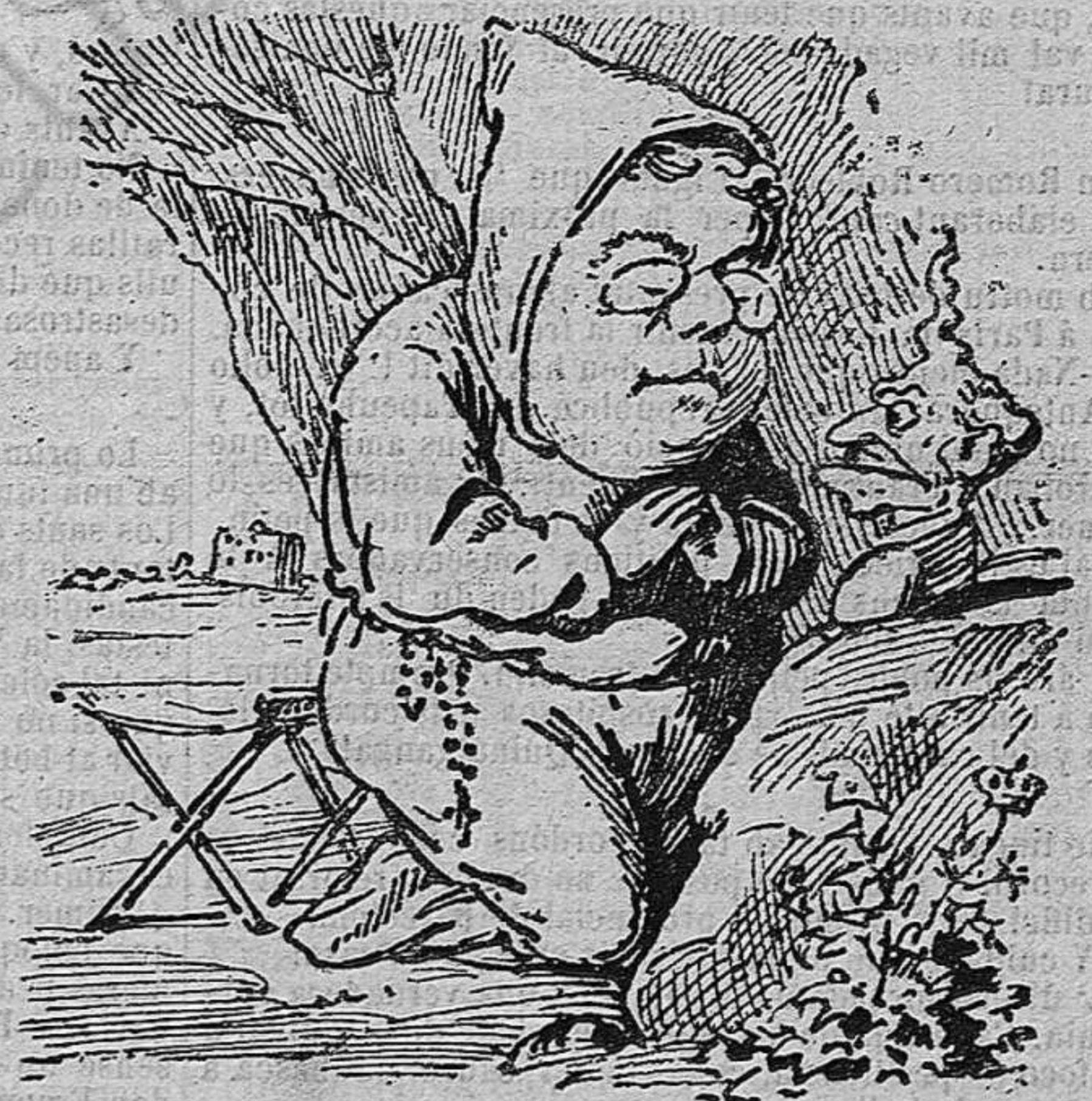
Fray Cristino ab fé traidora muda de sant á cada hora.