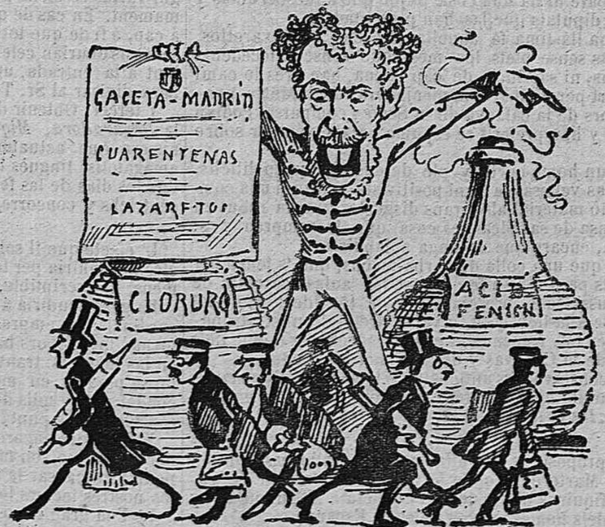
¿Cólera á Paris ja hi ha? ¡Microbis, alsa, á cobral!