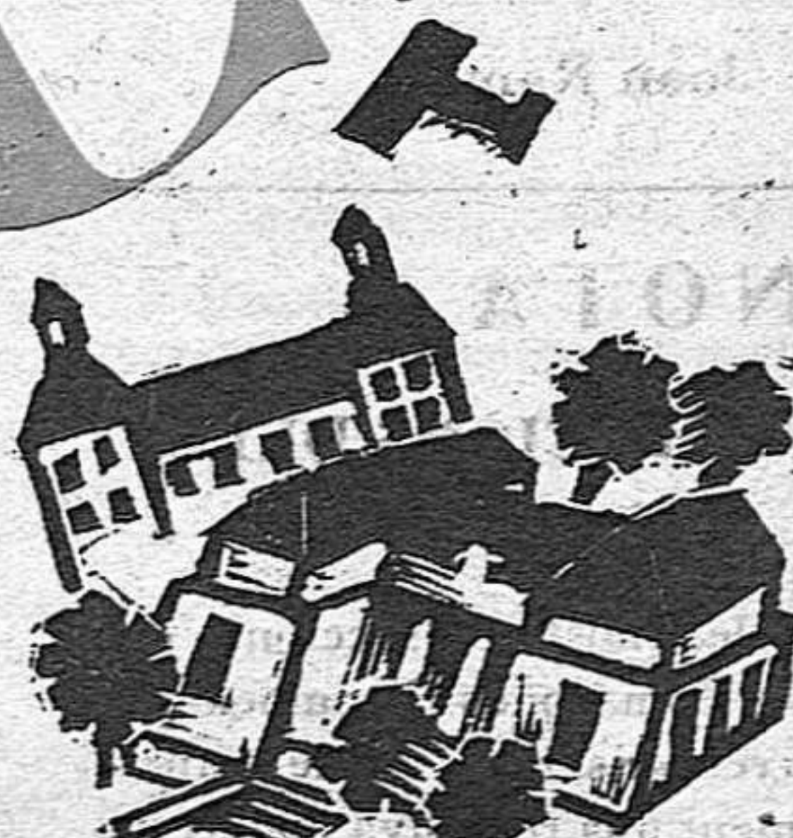
... i el Museu del Prado, llar artística