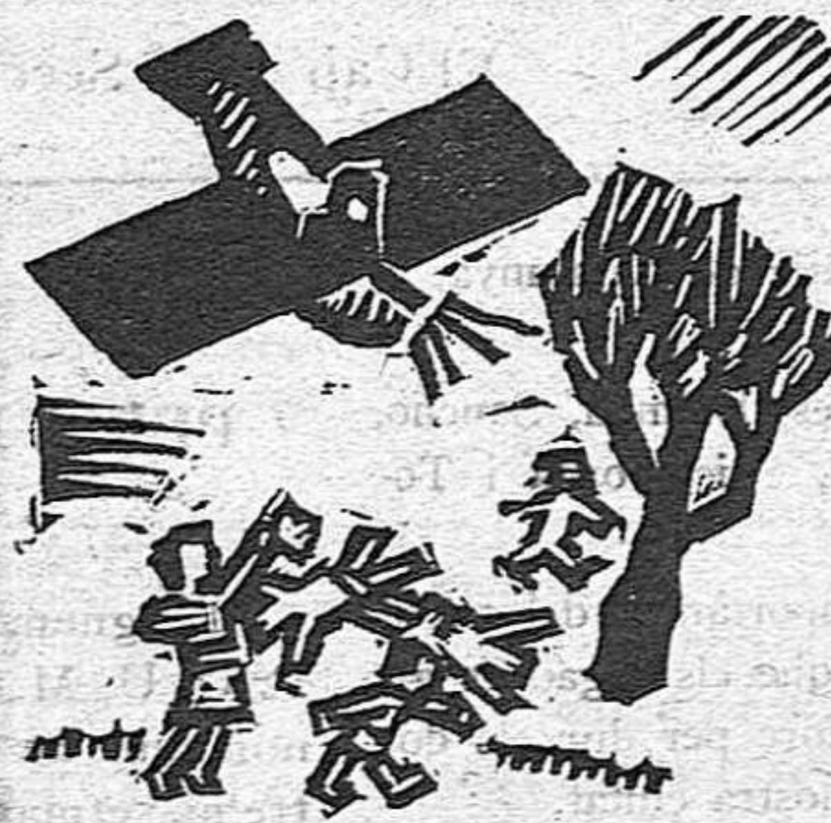
... i els infants de les escoles