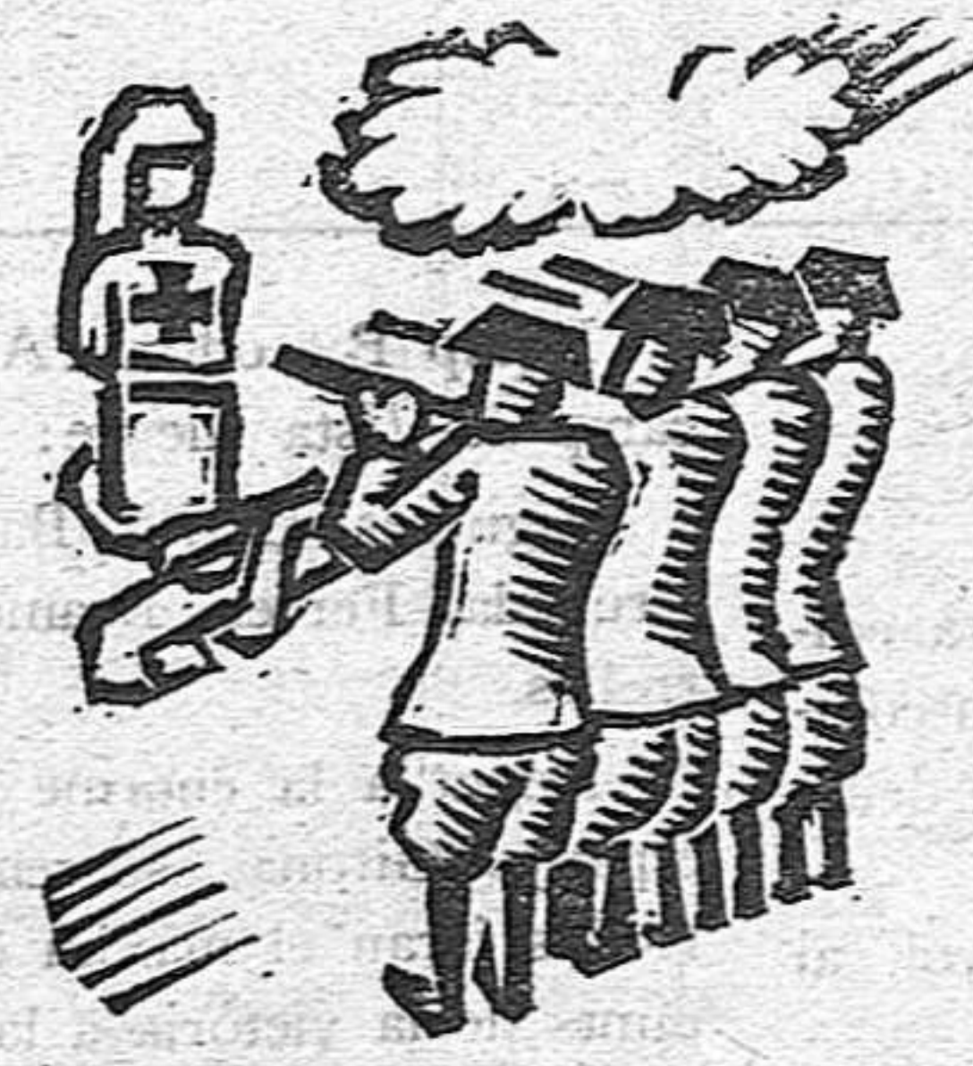
... i les infermeres