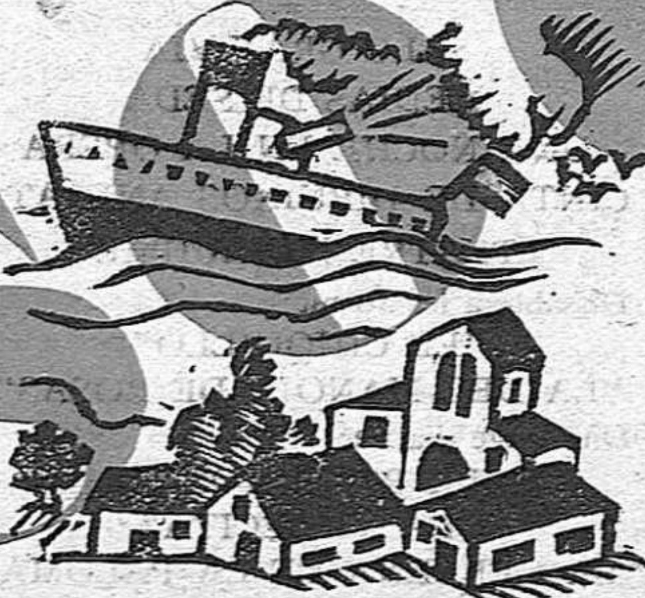
Palamós, vila indefensa, es canonejada