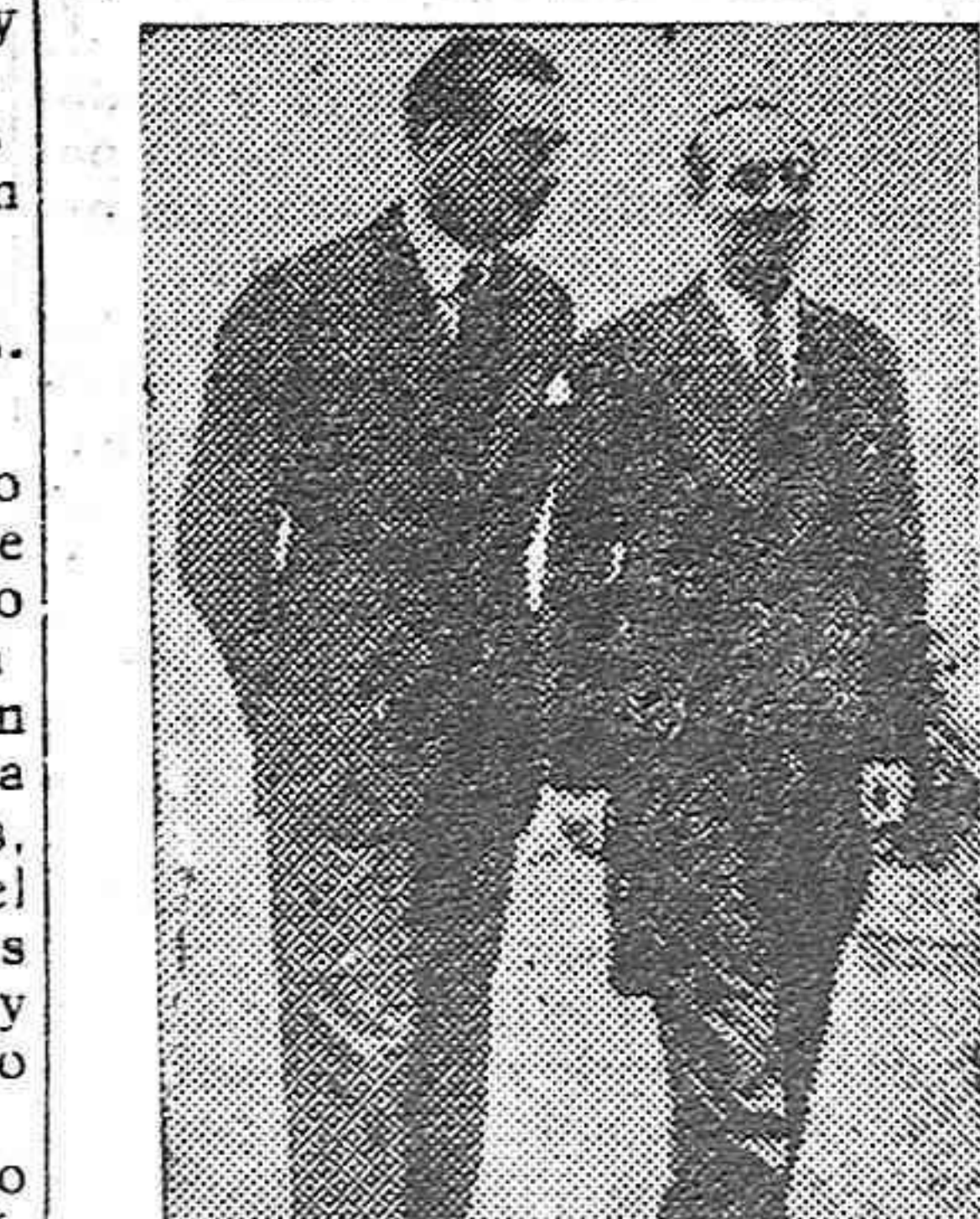
Mr. Anthony Eden, que en nombre del Gobierno inglés ha dado la bienvenida a las tropas expedicionarias australianas y neozelandesas a su llegada al próximo Oriente. En la derecha de la foto el político belga Van Zeeland.

Osio.— El ministro de Alemania en esta capital ha salido para el «fiord» de Jossing, a fin de tomar parte en las honras fúnebres a los muertos del «Altmark». La ceremonia se celebró ayer por la tarde.