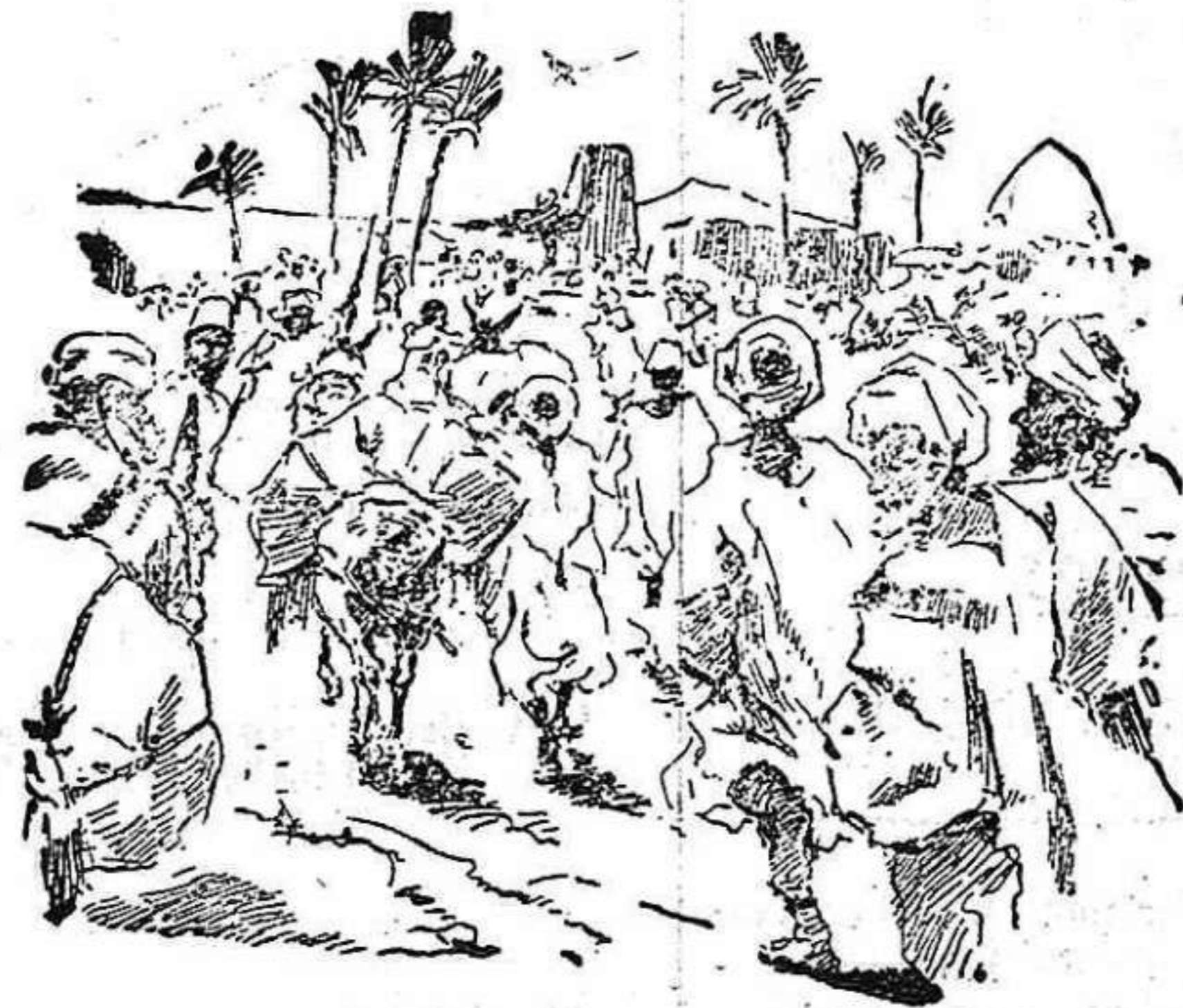
Moros rebeldes huyendo del avance de nuestras tropas hacia Nador.