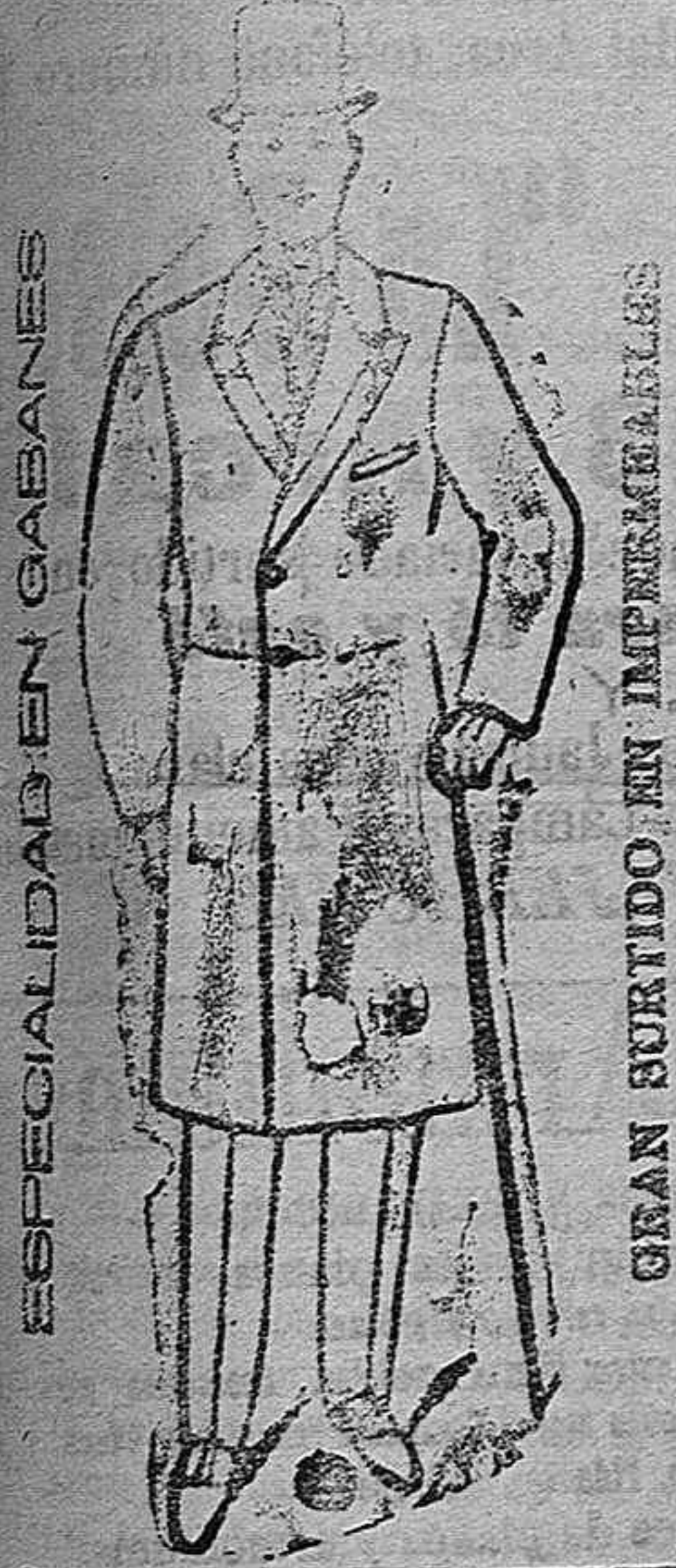
ESPECIALIDAD EN GABANES

GRAN TIENDA de modas de mujer y niños. Calle de la Victoria, 11. 8-1