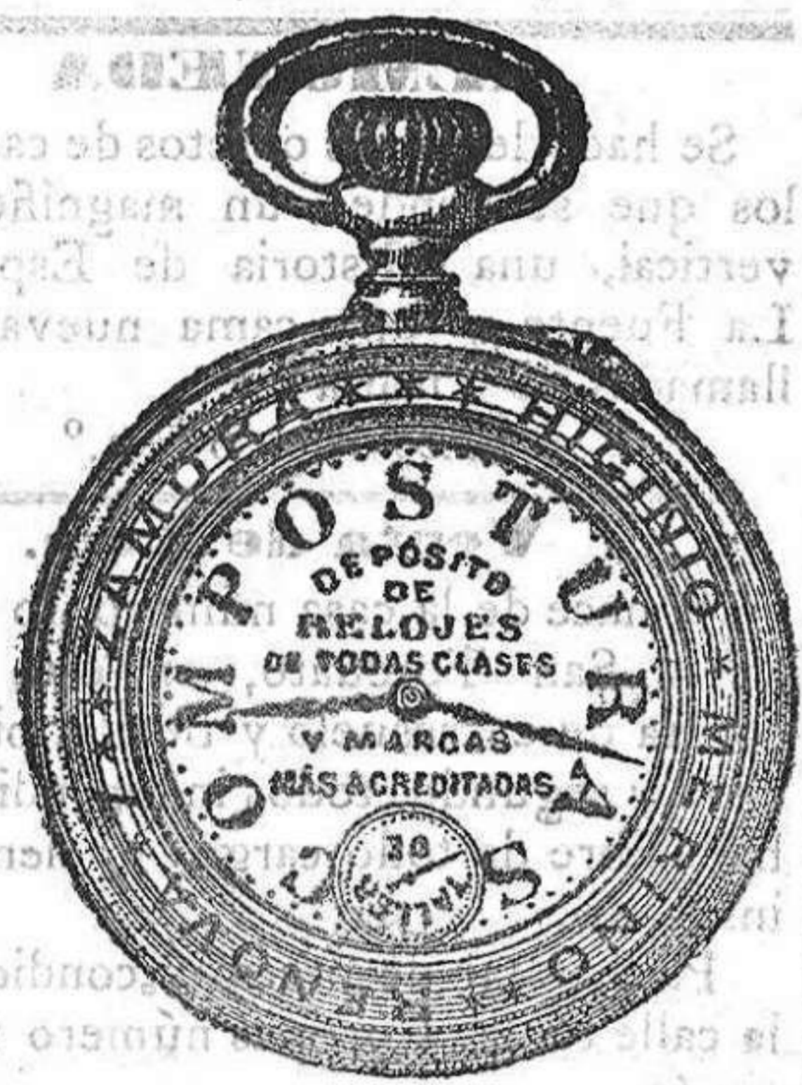
Relojes Mored, pendulos y Reguladores.