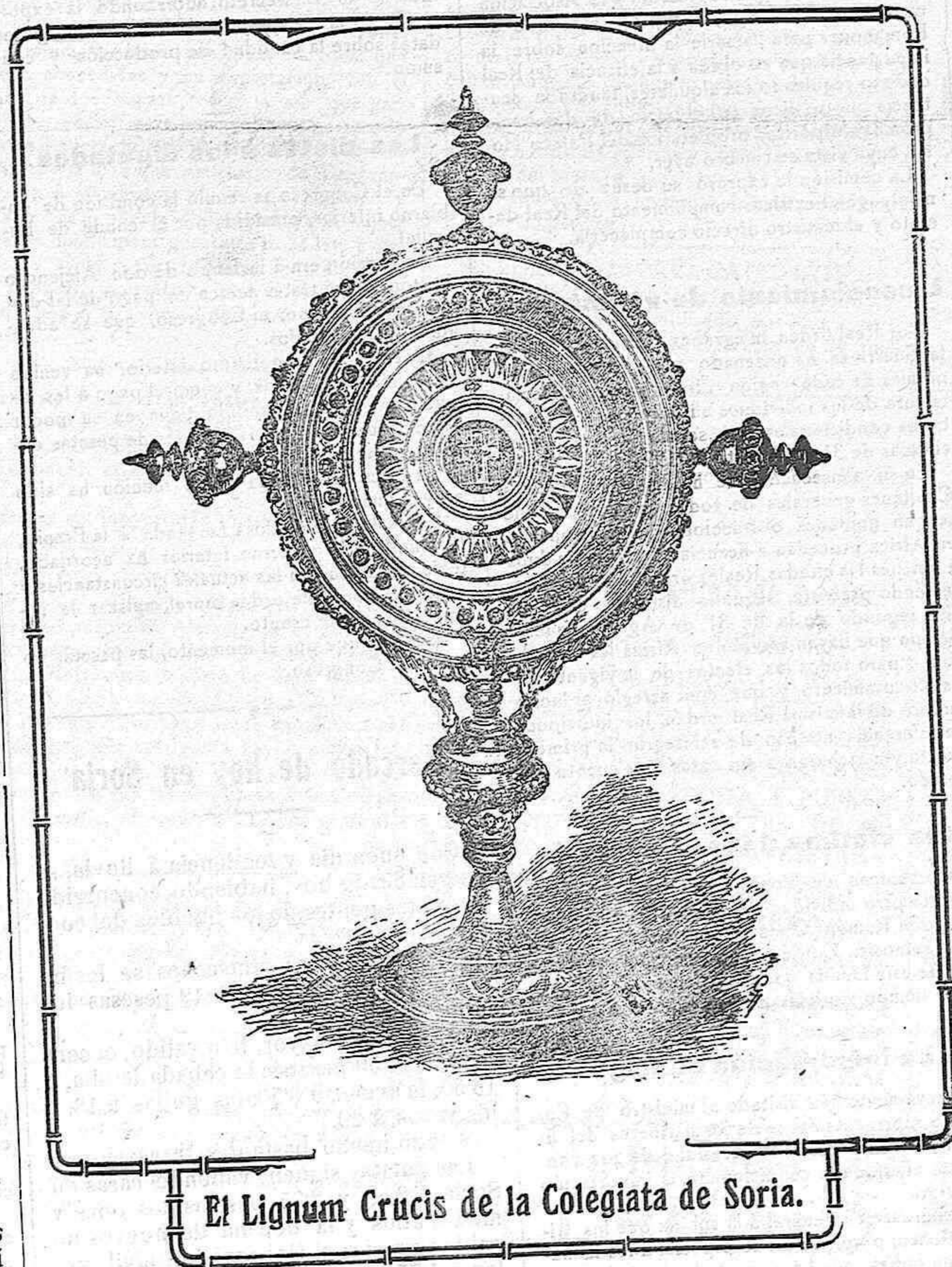
El Lignum Crucis de la Colegiata de Soria.