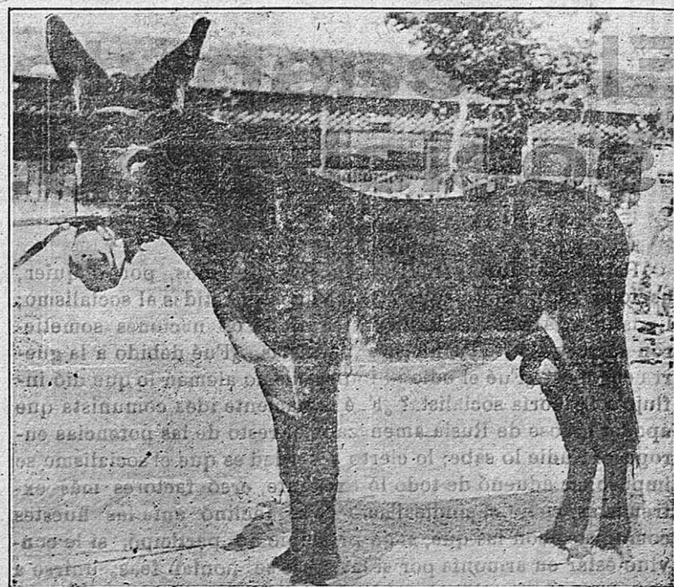
La presente foto corresponde a un magnífico ejemplar de garañón, al que se concedió una copa donada por la Asociación General de Ganaderos de España, en un certamen celebrado recientemente.

Ello es debido a que las materias alimenticias que contiene el suelo van haciéndose asimilables, es decir, utilizables, progresivamente, pudiendo por ello, considerarse en él dos categorías de elementos: una, constituida por las