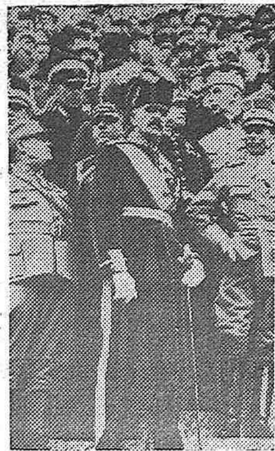
El general sueco Ernesto Linder tomó parte en la guerra de liberación de Finlandia, en 1918 y fué nombrado teniente general del Ejército finlandés. Ahora ha pasado el pase a la reserva en el Ejército sueco, y se ha puesto al frente de los voluntarios que, en número cada vez más crecido, acuden en ayuda de Finlandia.