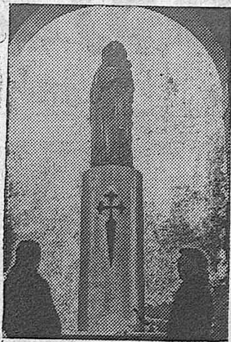
En la Puerta de Alcalá se ha insalado, bajo el arco central, una imagen de la Virgen del Pilar.