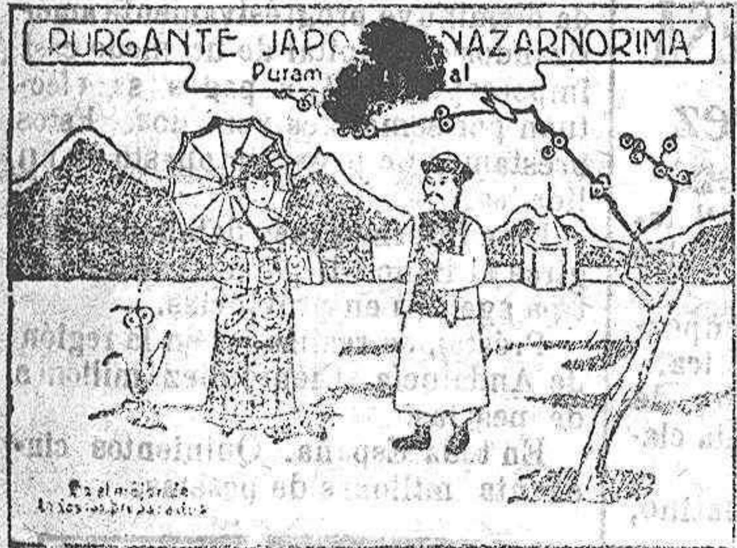
Sello Japonés "Gimen,"

Puede tomarse también tal como está preparado, sin disolverlo en líquido alguno; basta echarse a la boca y tomar un sorbo de agua, tía, etc., etc., resultando en este caso de sabor riquísimo. Solo cuesta 25 céntimos.