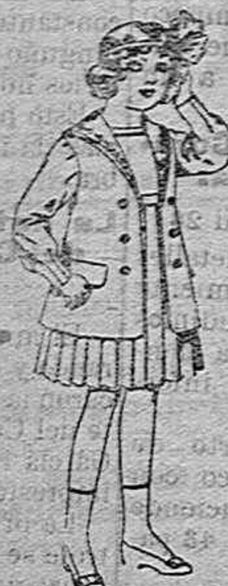
Traje de gubardina blanco, cuello de orhadin bordado, para niñas de 4 a 9 años. de pesetas 22 a 24.