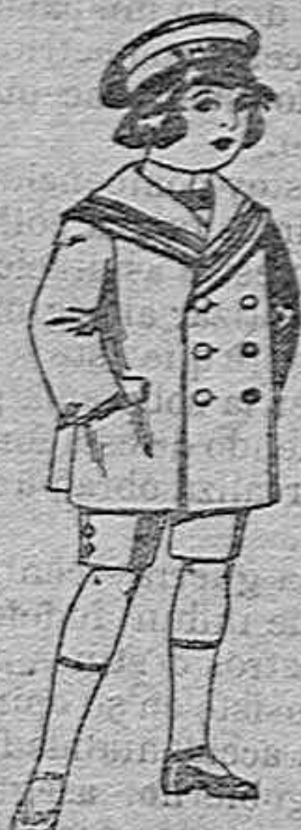
Trajés matelot de vicuña o jergal azul para niño de 4 a 9 años de 14 pesetas a 32.