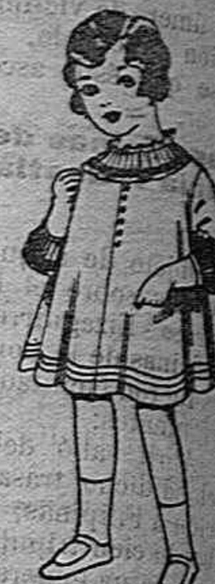
Vestidos de velo blanco bordado. de ptas. 60 a 80

Géneros del país y extranjeros para la Sección de Medida. Sombreros de paja de 2.50 a 12 pesetas.