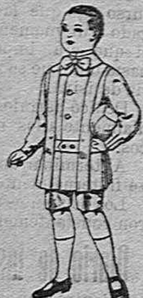
Trajés de lanilla para niños de 4 a 9 años. de ptas. 12 a 31