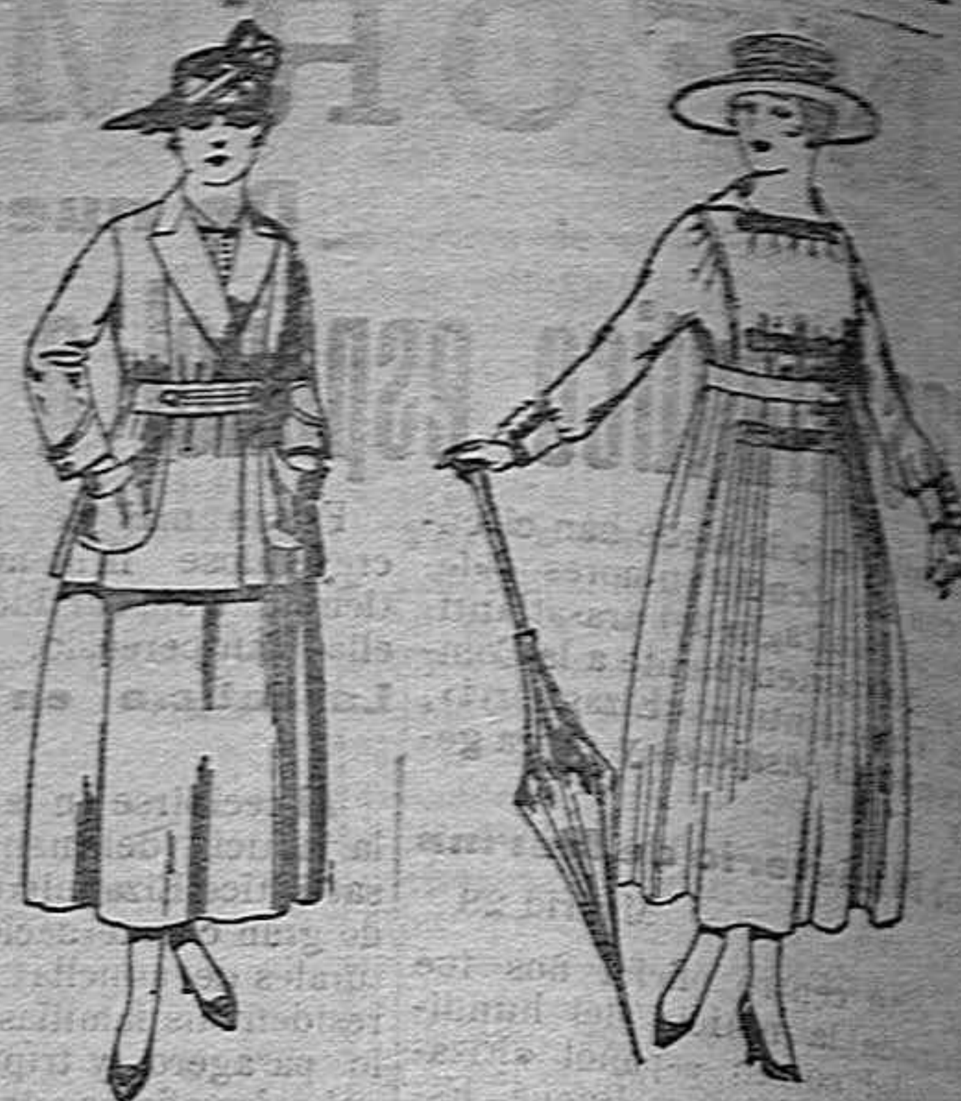
Traje de estambre negro, azul y color de ptas. 70 a 70. Vestidos de lanilla negra, azules, colores de ptas. 60 a 70.