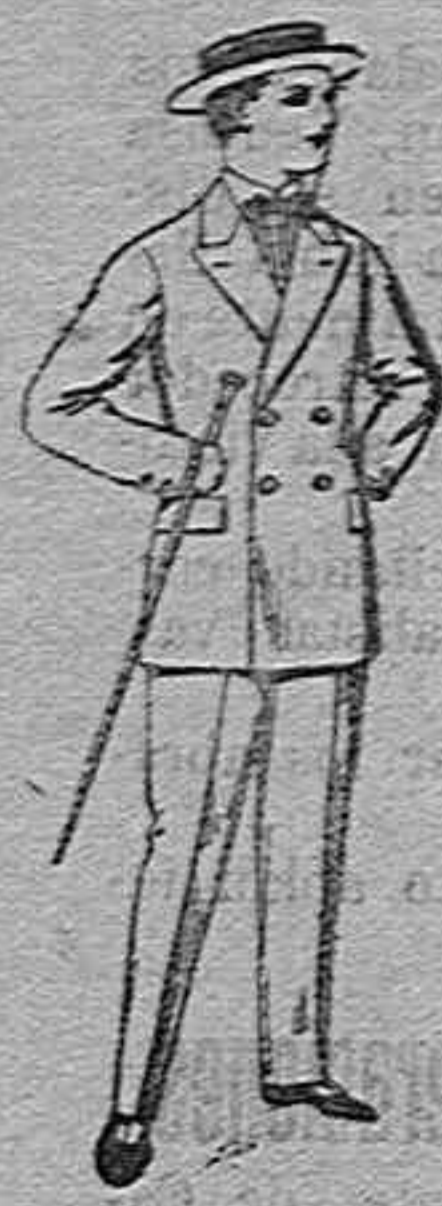
Traje de estambre, vicuña o jersey, para jovencito de 10 a 17 años. de ptas. 10 a 50.