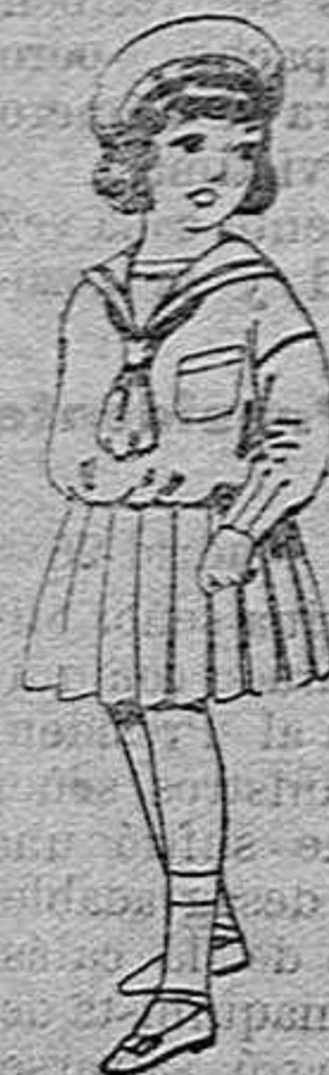
Trajés de marinera de lanilla azul para niñas de 4 a 9 años de pesetas 32 a 38 los mismos de dril blanco de 13 a 24 pesetas.