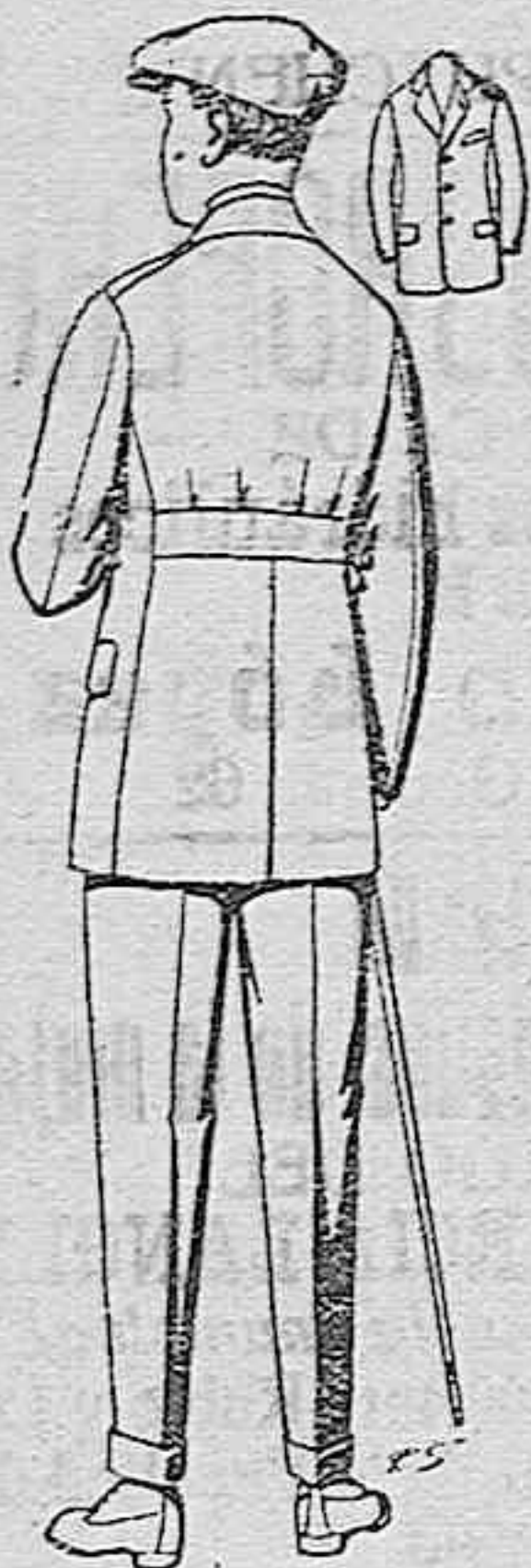
Trajes modelo sport, de lanilla, mellón, etc., para jovencitos de 10 a 15 años, de ptas. 27 a 52. Los mismos en dril de ptas. 11 a 21.