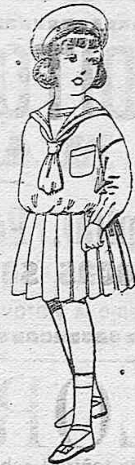
Trajes de marinera de lanilla azul para niñas de 4 a 9 años de ptas. 32 a 38. Los mismos de dril blanco de 13 a 24 ptas.