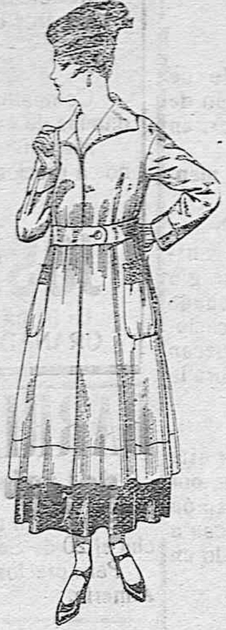
Abrigos de tricot de lana, en colores lisos, de pesetas 63 a 75.