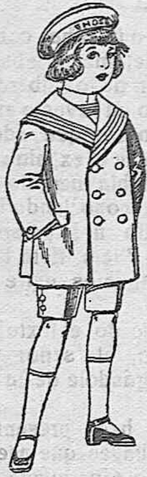
Trajes matlot de vicuña o jergal azul para niño de 4 a 9 años de ptas. 14 a 32