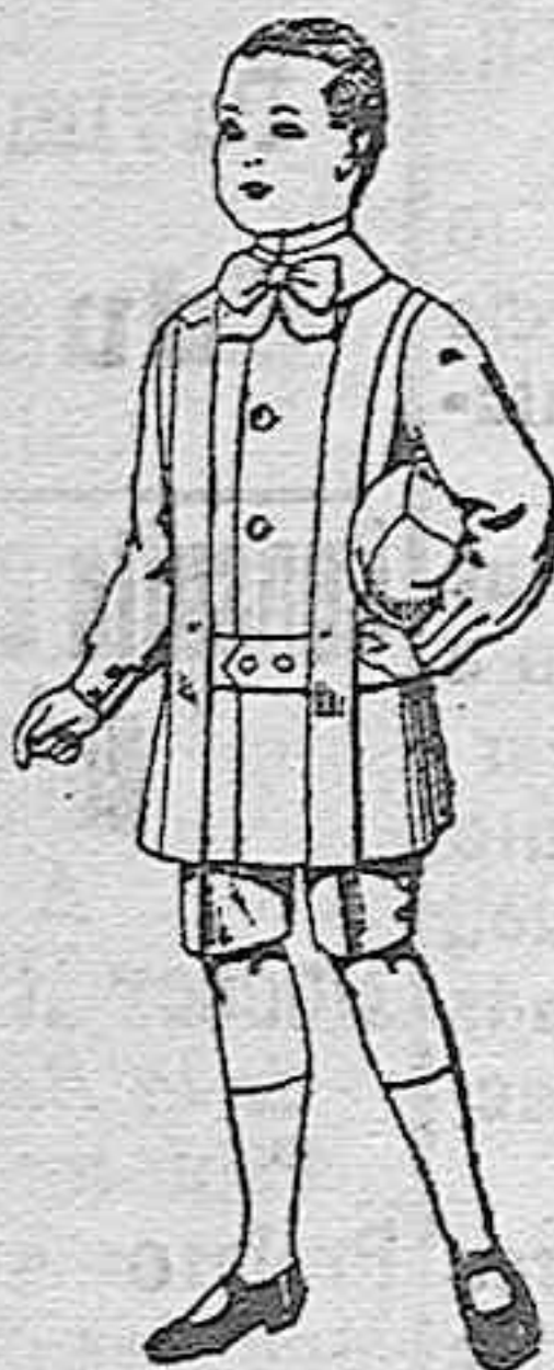
Trajes de lanilla para niños de 4 a 9 años de ptas. 12 a 31.