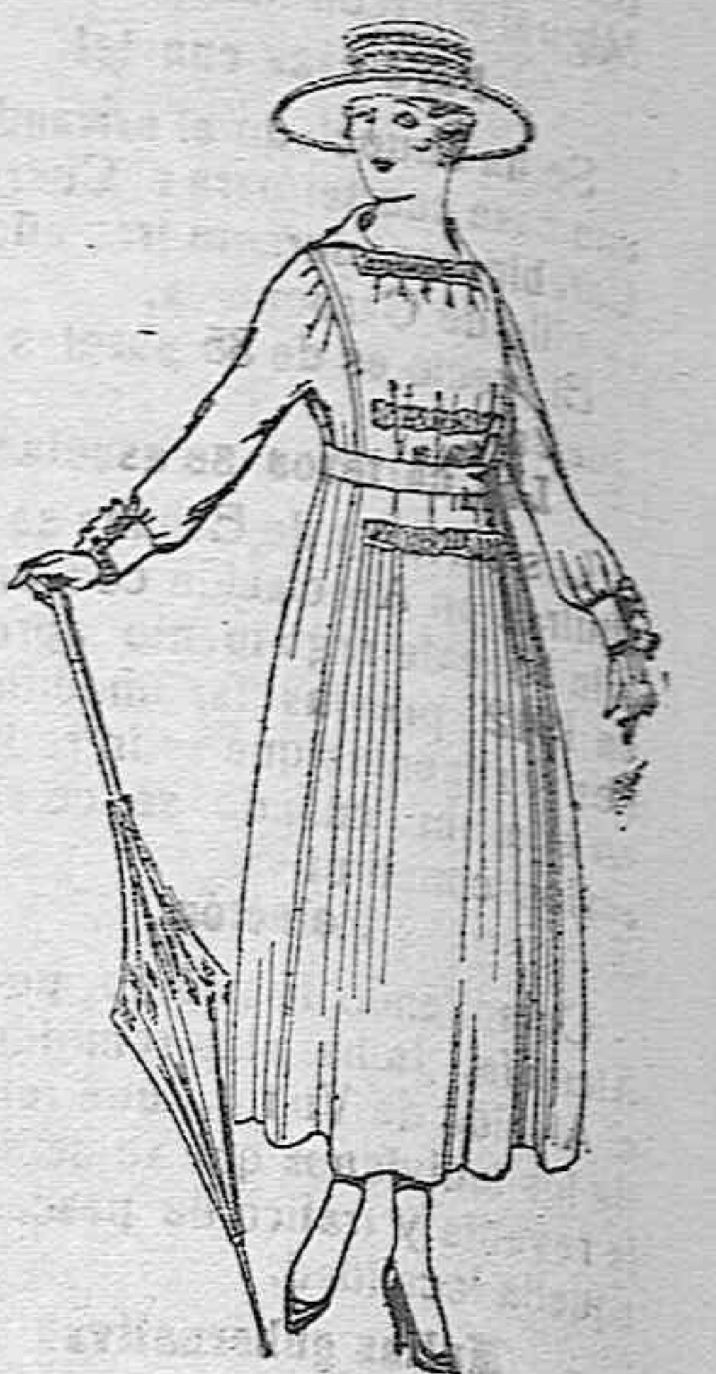
Vestidos de lanitas negras, azules y colores, de pesetas 60 a 70.