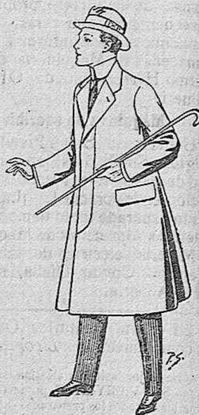
Gabanes de lana vigonia o milton, con forros de saten o seda para niños de 10 a 12 años, de pesetas 20 a 55