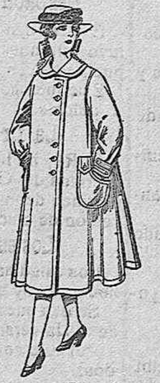
Abrigos de lana para jovencitas de 11 a 15 años, de ptas. 35 a 40