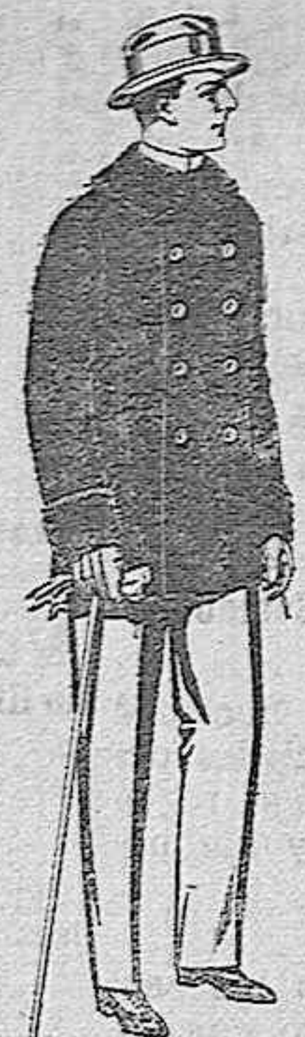
Pellicas de ratina con cuellos del mismo género y con astrakán, de pesetas 16 a 90