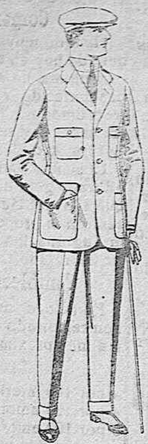
Trajes de cheviot, corte elegante, para sporman, de pesetas 45 a 55.