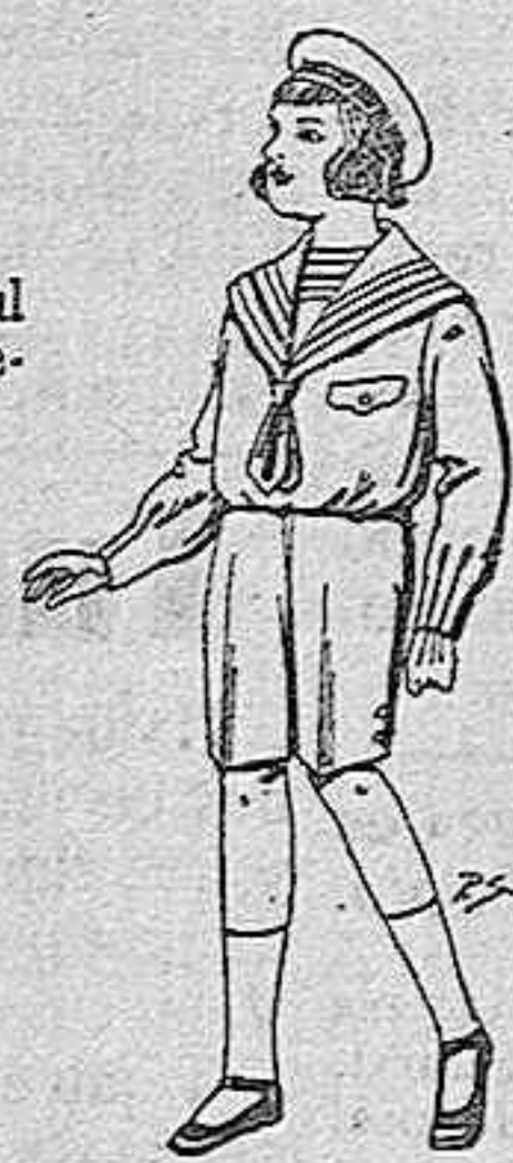
Trajes de gerga azul, para niños de 4 a nueve años, de ptas 9 a 22