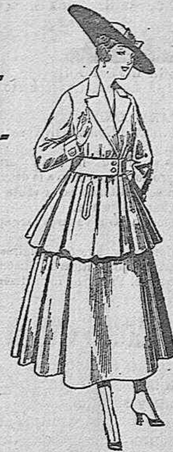
Traje de lana, en negro, azul y color, para señora, de pesetas 90 a 100