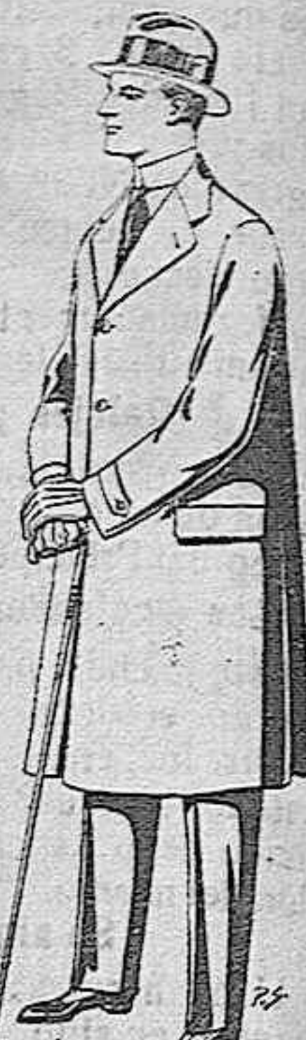
Gabanes de tejido pinma o ratina, de pesetas 88 a 110.