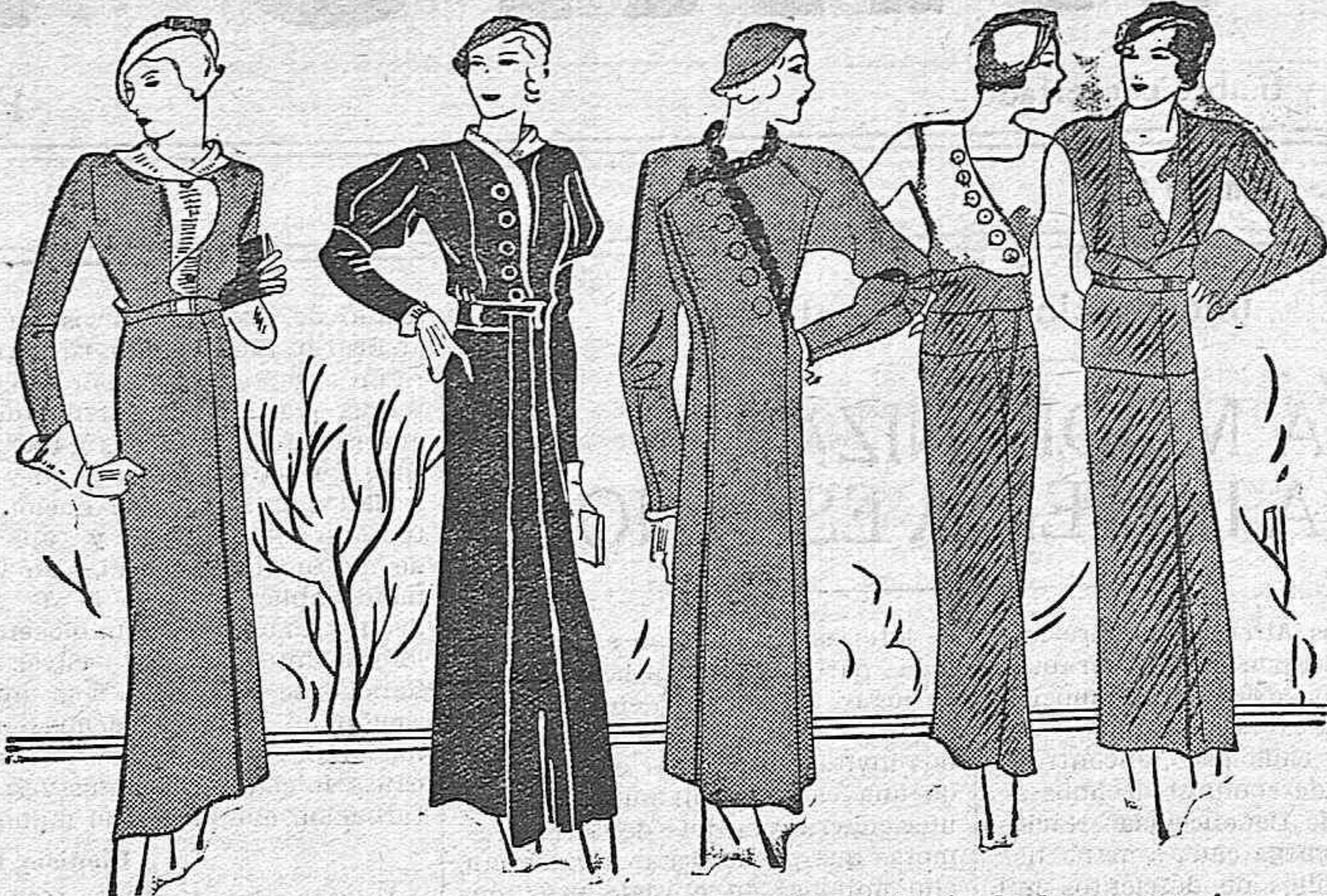
1.—Traje de lanilla verde Imperio adornado con piqué.—2. Traje de lana esponjosa negra adornado con un plegado de «georgette» color paja.—3. Abrigo primaveral de lana azul marino adornado con una gruesa trenza de terciopelo verde jade.—4 y 5. Trajes sastre de lana roja con blusa de «voile se scie» triple blanca.

Entre otros acuerdos, se adoptó el de un voto de censura para los diputados socialistas por Madrid, por el hecho de votar los créditos que habrán de ser destinados para reorganización y mejoramiento de la Guardia civil.