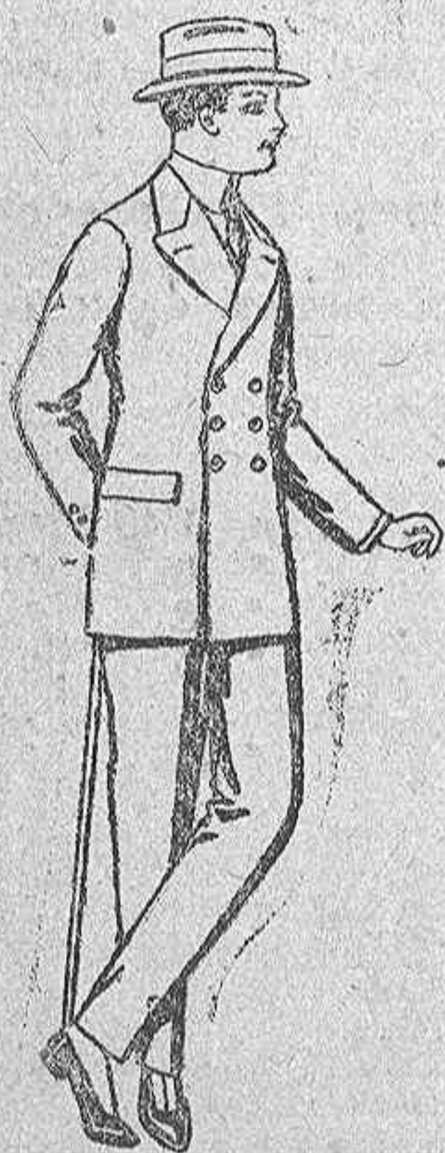
Trajes de lanilla, vicuña o estambre, para jovencitos de 10 a 12 años. De ptas. 23 a 58