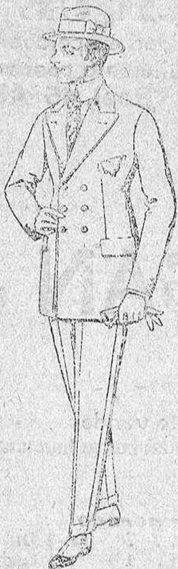
Trajes de lanilla, melton, estambre, etc. De ptas. 33 a 90.