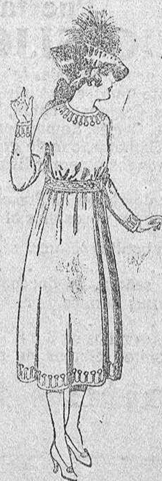
Vestidos de sarga inglesa, estambre, etc., en azul y colores adornos bordados. De ptas. 45 a 55.

Camisería, Géneros de punto, Corbatería, Guantería, Sombrerería, Zapatería, Paraguas, Bastones y Artículos de Viaje.