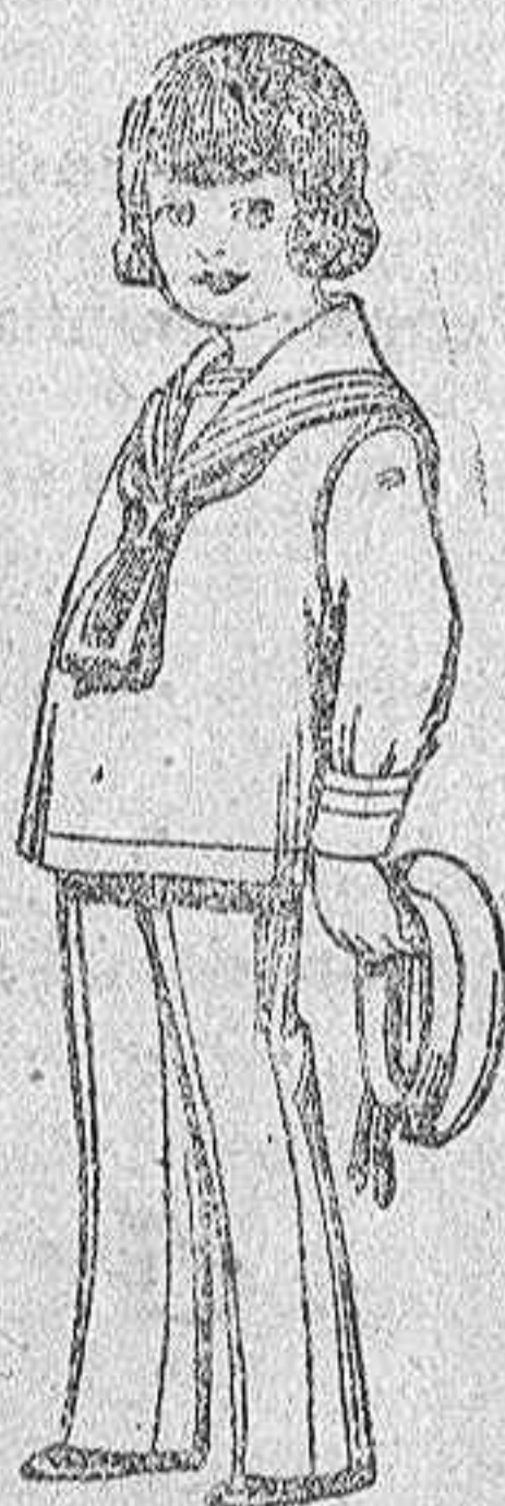
Traje modelo «marinera inglesa», de vicuña o estambre azul o negro para niños de 4 a 9 años. De ptas. 26 a 34

Camisería, Géneros de punto, Corbatería, Guantería, Sombrerería, Zapatería, Paraguas, Bastones y Artículos de Viaje.