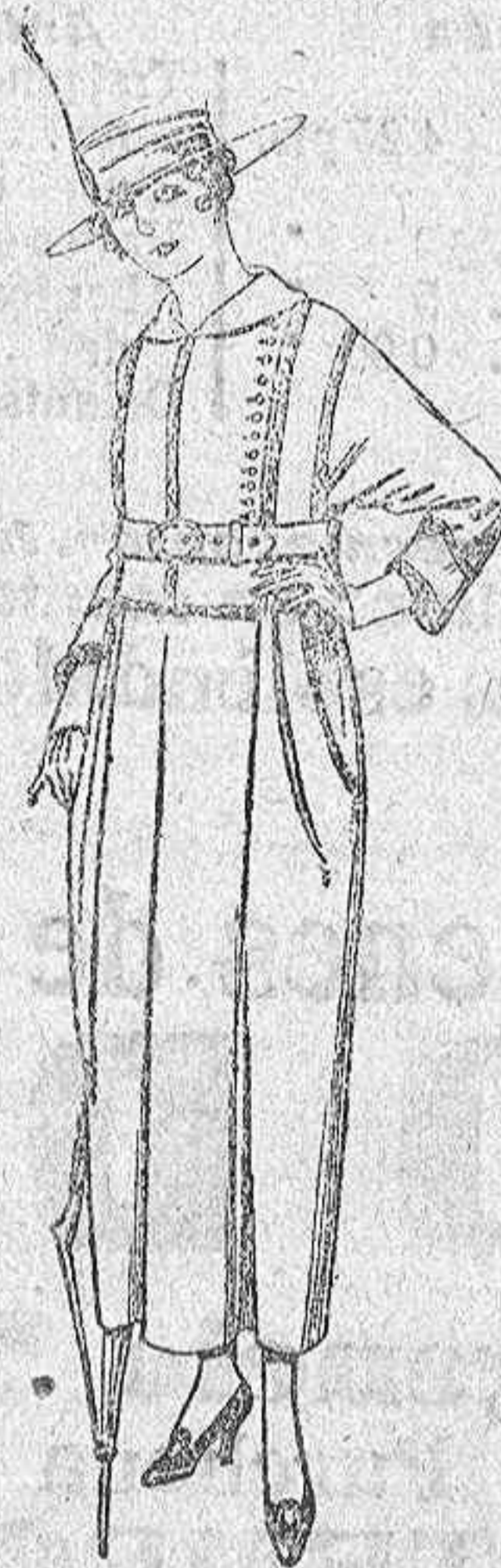
Vestidos de sarga inglesa estambre, lanilla, etc., en negro, azul y color. De ptas. 70 a 75.