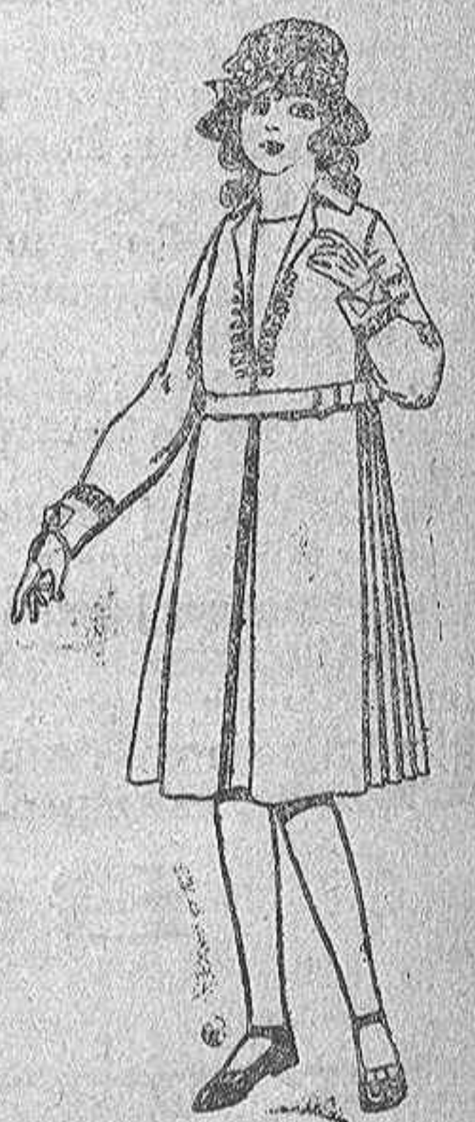
Vestidos de lanilla, estambre, etc., bordados, para niños de 4 a 9 años. De ptas. 34 a 42.