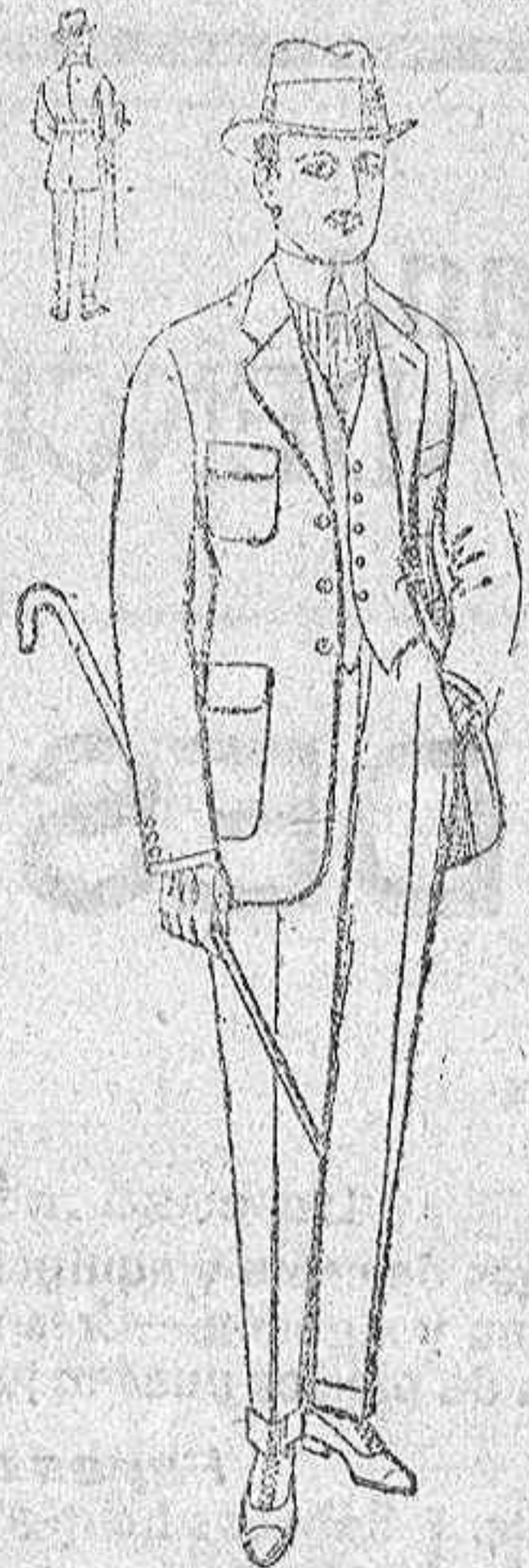
Traje modelo sport, de lanilla, melton, etc. De ptas. 37 a 85.