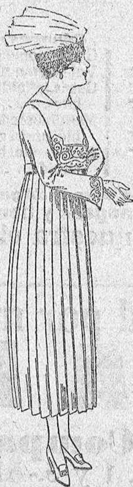
Vestidos de sarga inglesa, estambre, etc. en azul y color, bordados a mano. De ptas. 75 a 85.