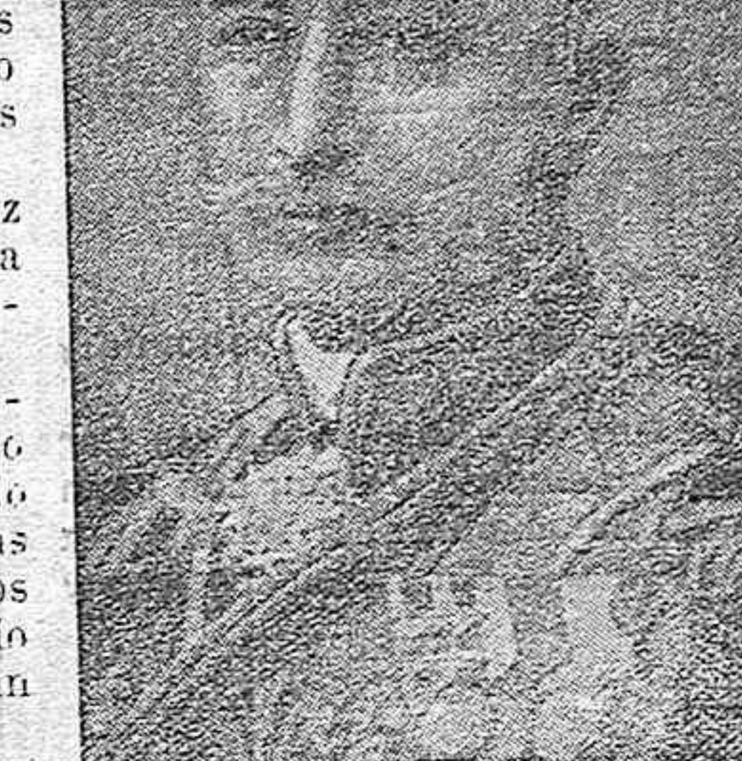
El general Ruso Brusiloff