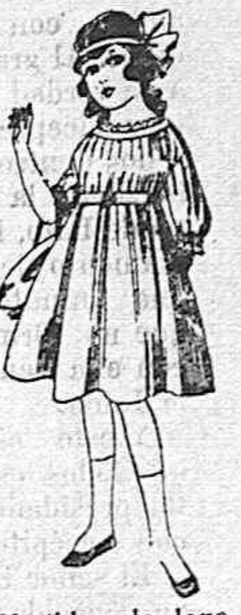
Vestidos de lana, azul, para niñas de 4 á 9 años De pesetas 22 á 25 Los mismos en voile. De pesetas 10 á 17