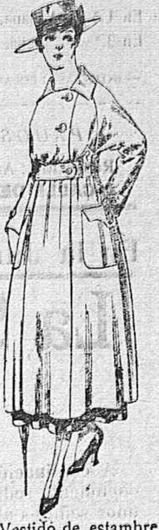
Vestido de estambre negro, azul y colores bordado De peseta 64 á 75