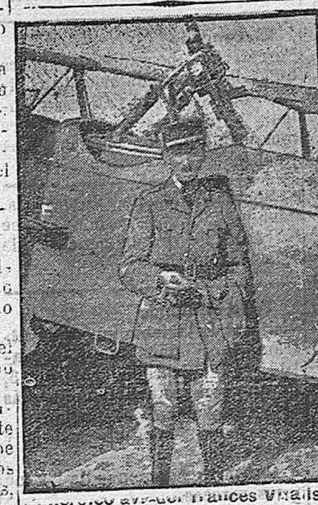
...del grupo de los señores VMAIS

La labor realizada por la comisión de Festejos, merece todo género de aplausos que nosotros le tributamos.