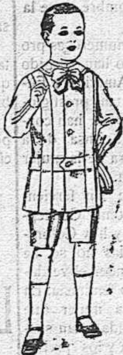
Trajes de lanilla, melton, etc. para niños de 4 á 12 años De ptas. 16 á 33.