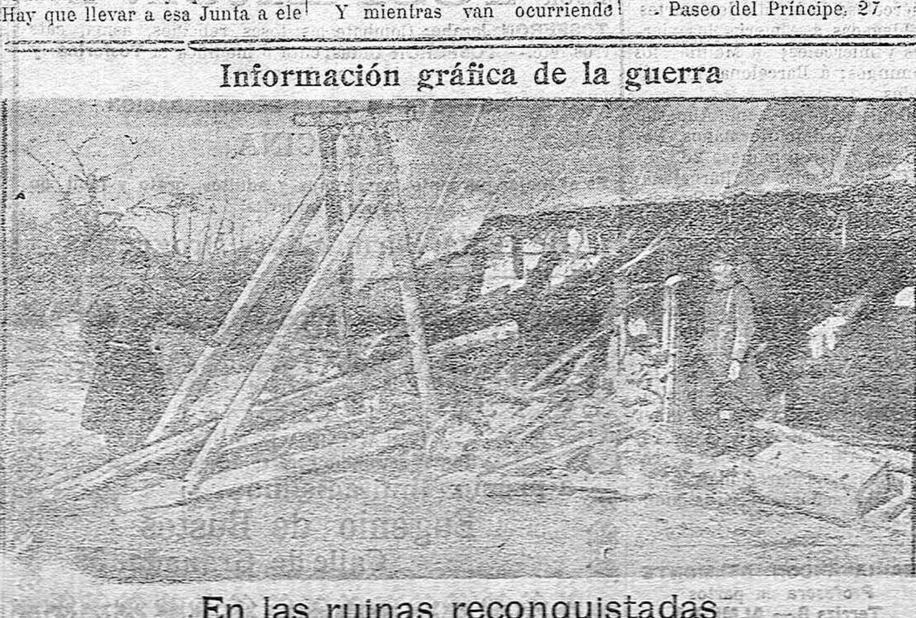
En las ruinas reconquistadas