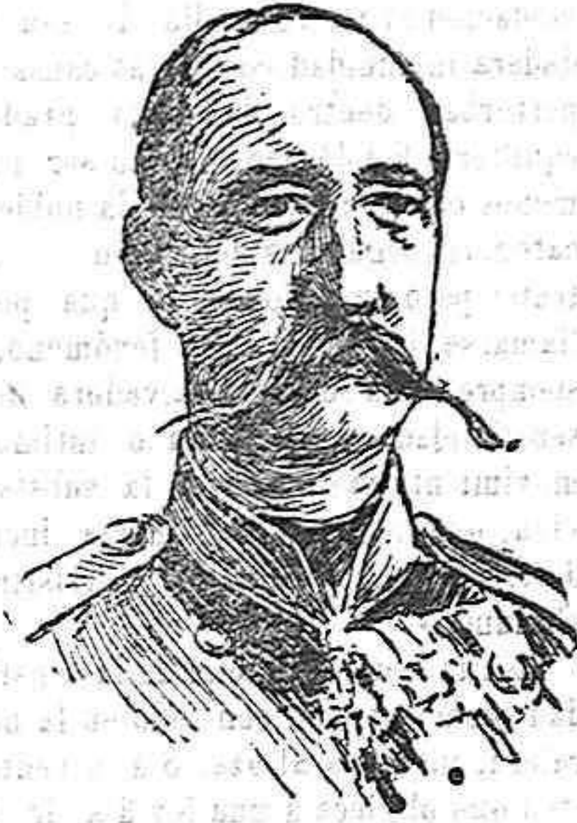
El Rey Jorge de Grecia.

llas de esa Liga, á cuyo frente figura el general Trorbas, prometieron disolver aquella tan pronto el Parlamento aprobara el proyecto de convocatoria de una Asamblea Nacional para la reforma de la Constitución.