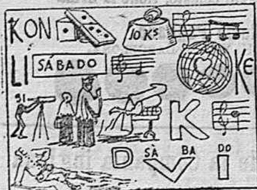
(La solución mañana).

Sección recreativa. Solución á la frase hecha de ayer: Tirar la plata JEROGLIFICO.