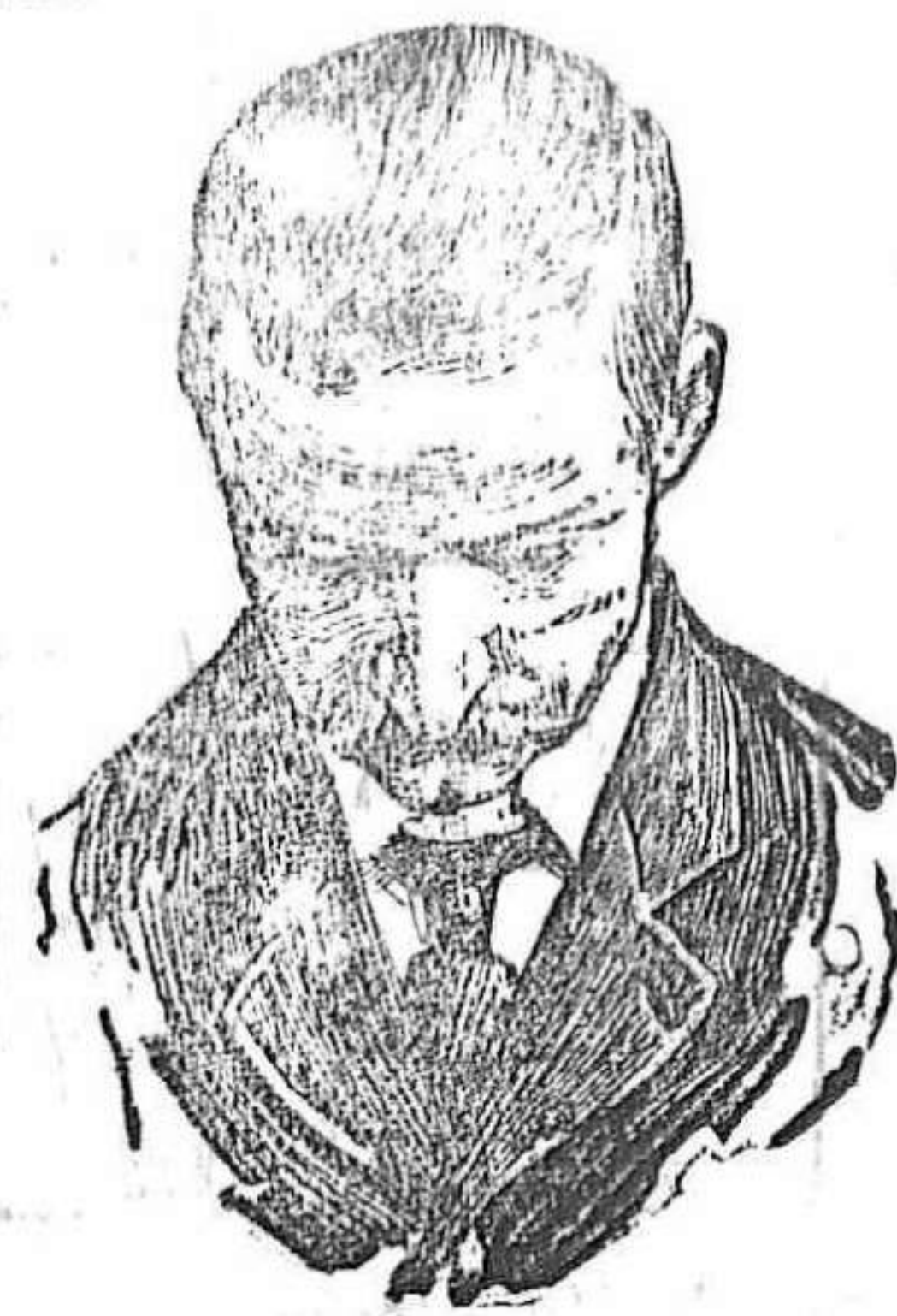
Después de usar el Capilho