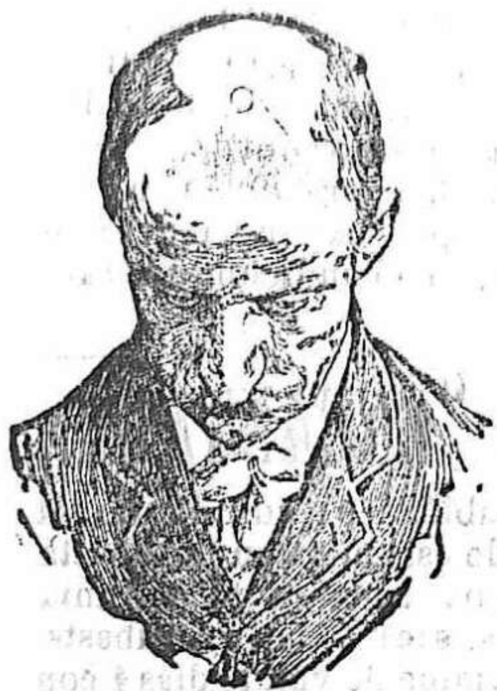
Antes de usar el Capilhol.