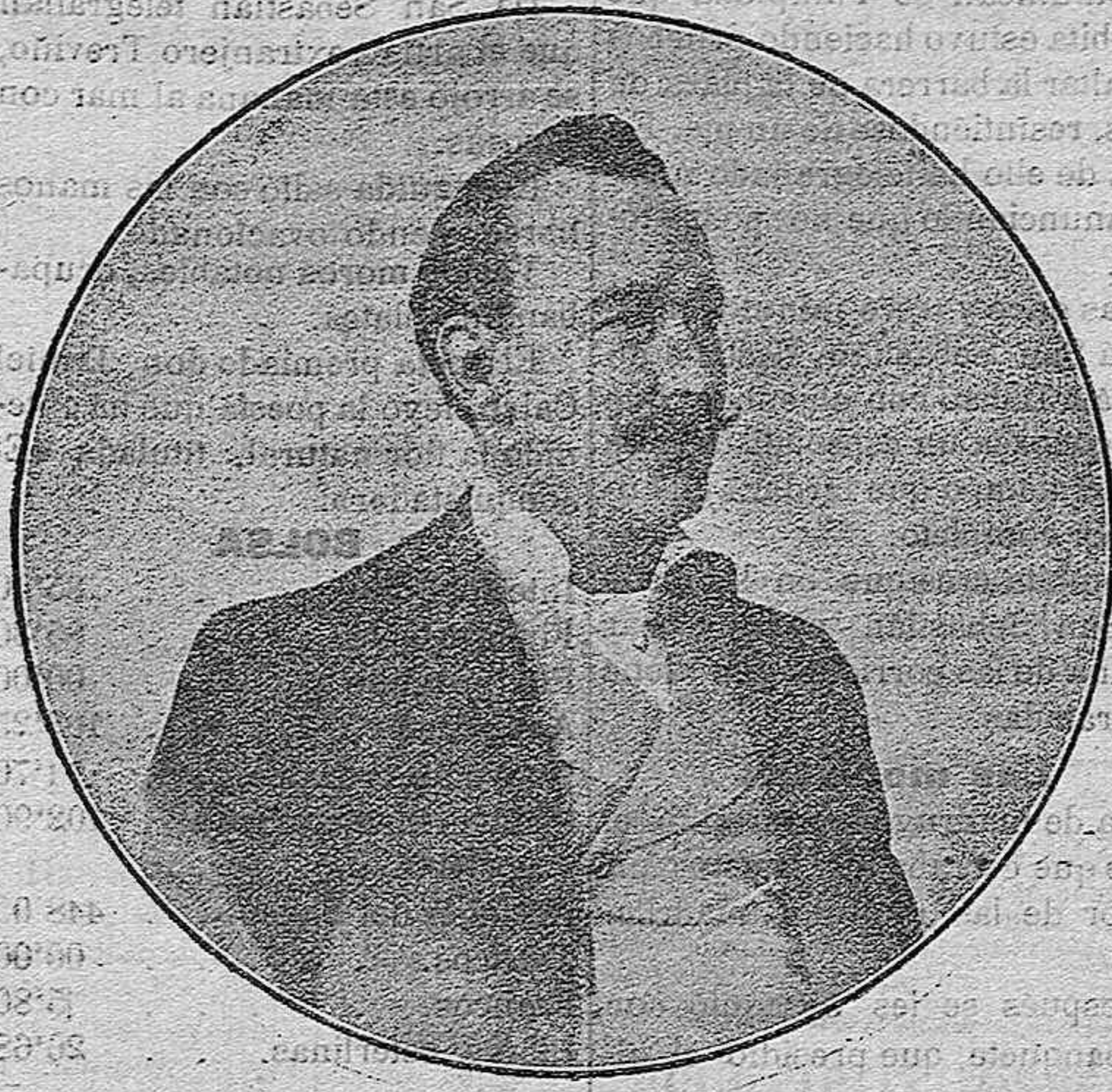
EL TENOR IRIBARNE

«¿Quién no conoce a Iribarne? Conseguido en el arte desde hace muchos años, su nombre se extendió rápidamente por todas partes. Iribarne es el cantante de escasas facultades, a quien sólo compatriotas aplauden; no es el artista que suple la falta de condiciones naturales con el traje estrambótico y el relato de fantásticos y supuestos éxitos; no es, en fin, el cómico sólo conocido en casa.