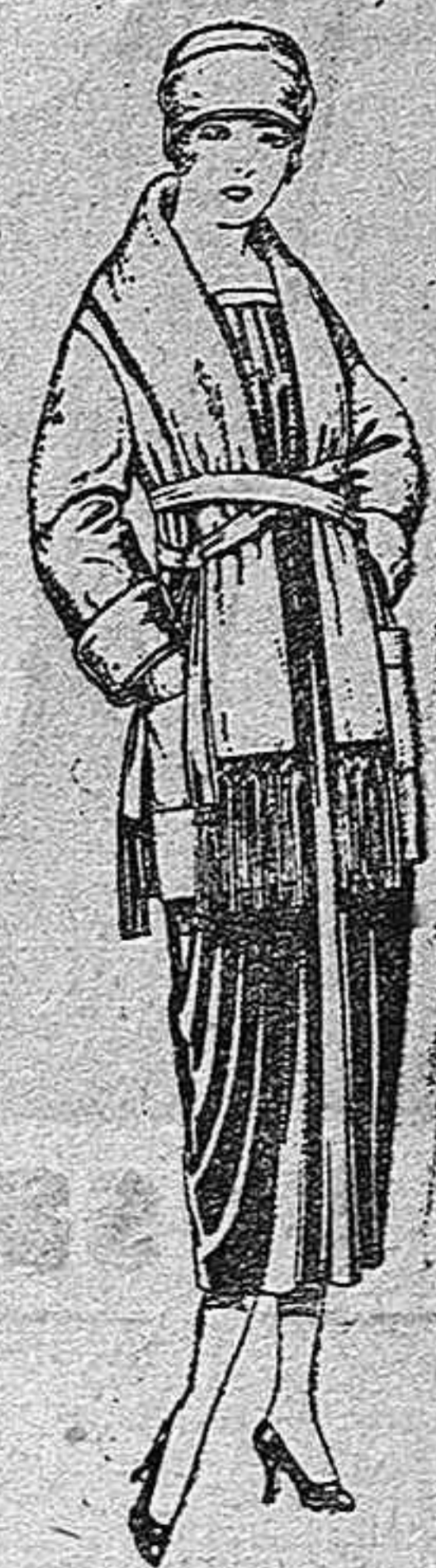
Paletots de punto de lana, cuello bufanda de p-seta 32 a 60.

PELETERIA Camiseria Géneros de punto Gorbateria Guanteria Zopoteria Sombrereria y Parauguas