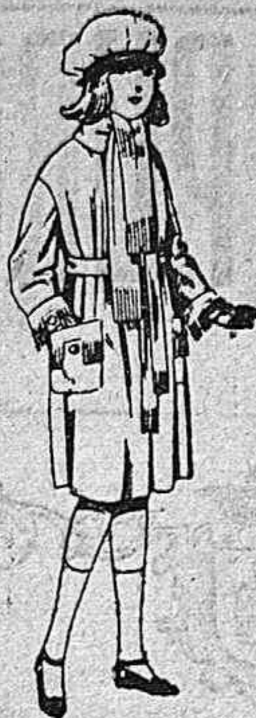
Abrigos de gamuza, pañete, cheviot, etc, en azul y color, para niñas de 4 a 9 años, de pts 36 a 50.