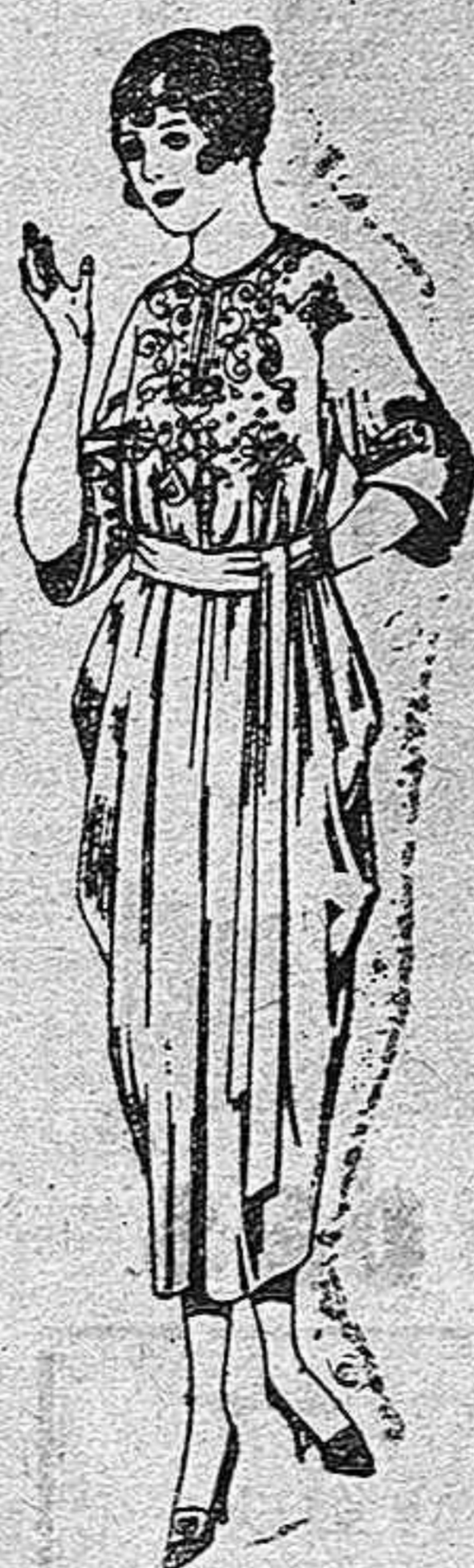
Batas de franela adornos bordados de pesetas 14 a 16

ROPAS Confeccionadas Para Caballero Señora Niño y Niña