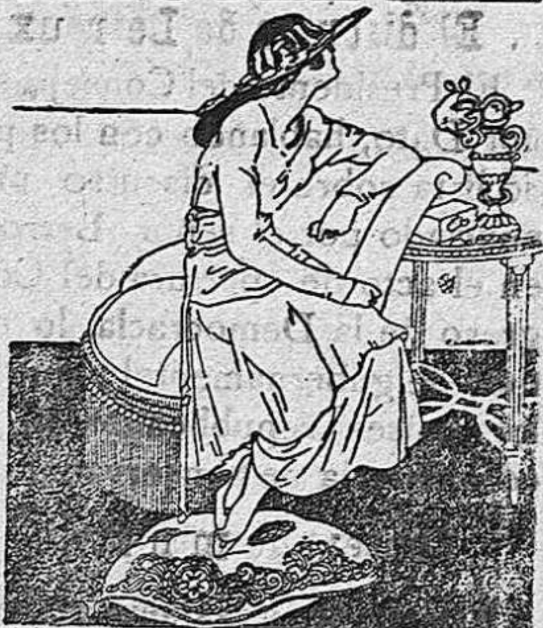
CHOCOLATE CON LECHE SVIZA

El único que gastan las personas distinguidas y que regala participaciones de la