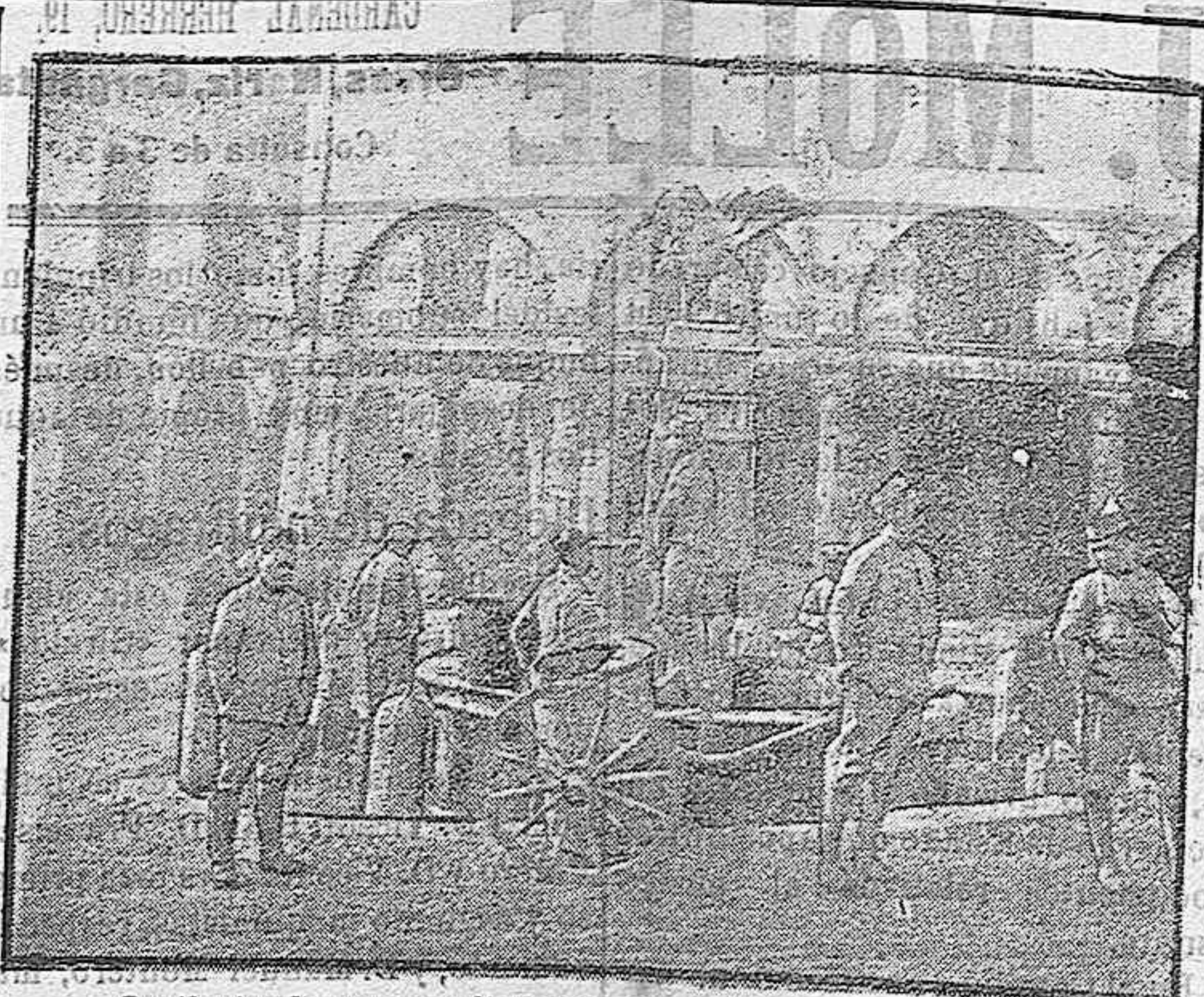
Centinelas franceses e italianos en una trinchera junto al Piave.

Realmente, lo confieso, quedé sorprendido. No es cosa fácil cuando se tiene veinte y cinco años y una cara fresca y bonita, dirigir de modo completo miles de obreras, porque, aunque se hayan realizado brillantes estudios en una Universidad provincial, la experiencia adquirida es poca, los conflictos que plantea una muchedumbre heterogénea son copiosos y el desempeño del cargo de jefe tropieza siempre con dificultades de diverso linaje. Porque las señoras «municionadoras», nombre que las enorgullece—reivindican áspereamente sus derechos y sus miembros de una Trade-Union, cuya Junta Di-