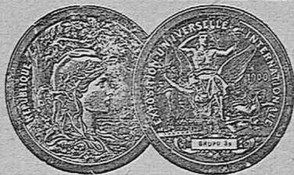
Medalla de Plata en la Exposición de Paris de 1900.